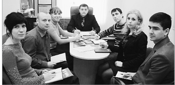
Молодежь советуется, как трудиться и жить дальше...