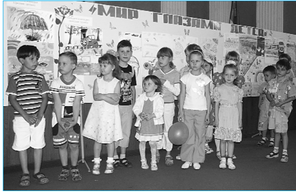
Вот они – юные художники...