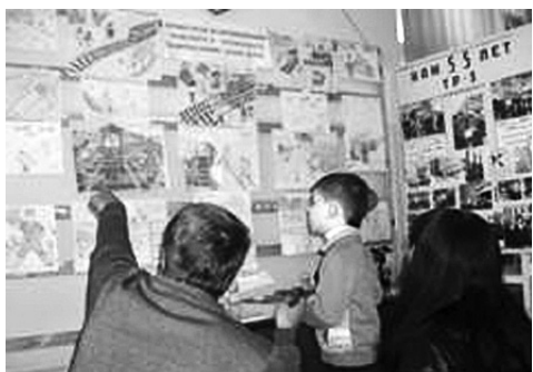
Діти залізничників у захваті від участі у тематичному конкурсі і подарунків, отриманих від профкому Лиманського локомотивного депо регіональної філії «Донецька залізниця»...