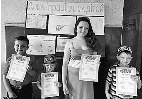
Учасників конкурсу дитячого малюнка, проведеного профкомом П'ятихатської коліїно-машинної станції регіональної філії «Придніпровська залізниця», нагороджено дипломами та заохочувальними призами.

НАШ ПРОФКОМ підбив підсумки конкурсу «Охорона праці очима дітей» і юних художників нагородив наборами для малювання. Дітлахи продемонстрували свої творчі здібності і підготували малюнки щодо дотримання правил безпеки на залізничному транспорті.