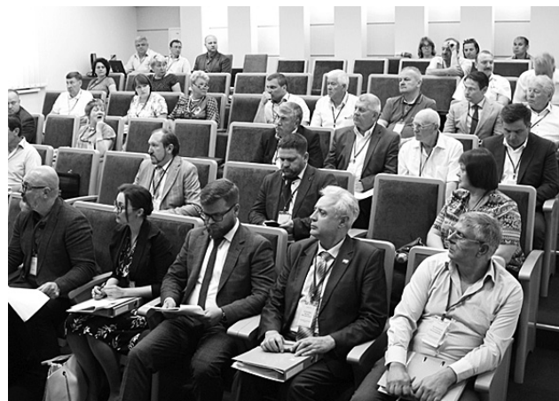
Під час засідання спільної робочої комісії 4 червня 2018 року

Розглянуто матеріали проекту колективного договору, затверджено попередньо узгоджену частину його тексту, опрацьовану робочими групами та винесену на розгляд. Також обговорено розбіжності щодо окремих питань, одне з яких було погоджено на засіданні шляхом компромісу. Ухвалено рі-