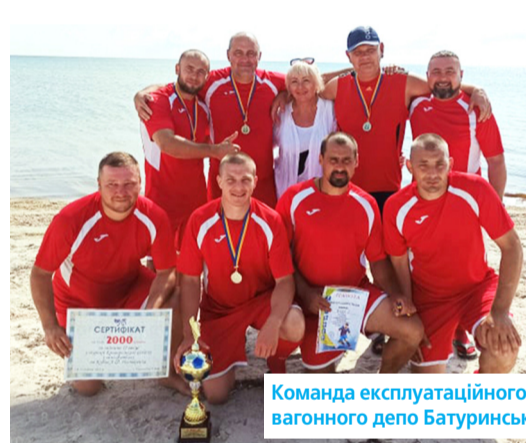
Команда експлуатаційного вагонного депо Батуринська

Вони розділилися на вісім команд, кожна з яких представляла свою первинну профорганізацію. Головний приз – кубок переможця та грошовий