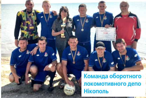
Команда оборотного локомотивного депо Нікополь

Друге та третє місце, а також відповідні кубки і грошові сертифікати дісталися залізничникам з експлуатаційного вагонного депо Батуринська та оборотного локомотивного депо Нікополь.