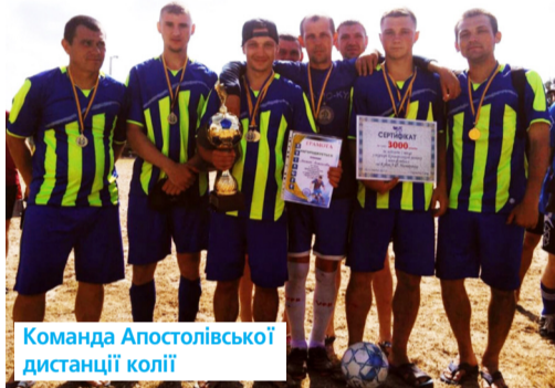
Команда Апостолівської дистанції колії

Заплановано організувати ділові зустрічі, де молодь зможе обмінятися досвідом, здобути необхідні знання та поглибити співробітництво задля розвитку молодіжного руху і впровадження ідей.