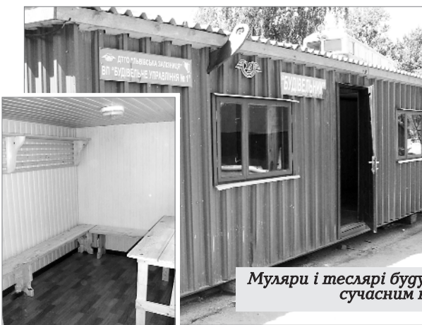
Муляри і теслярі будуправління задоволені сучасним виробничим побутом!

Профком не припиняє контролювати ці питання. На засадах дієвого партнерства з адміністрацією проблеми поліпшення побуту вдається вирішувати набагато швидше та оперативніше. Як тільки з'являється можливість – залучаються всі ресурси, щоб поліпшити умови праці і побуту.