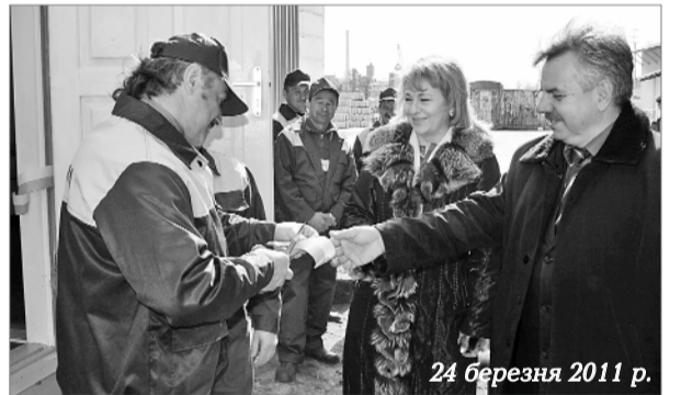
24 березня 2011 р.