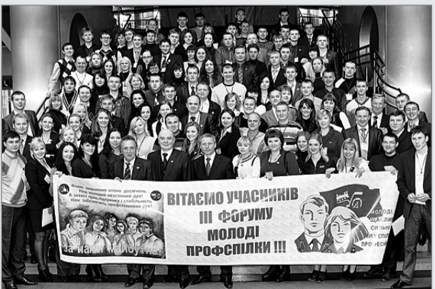
Фото на згадку

Цю пропозицію підтримано на засіданні Ради профспілки.