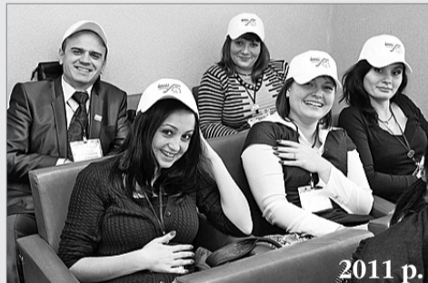
Делегати III Форуму молоді профспілки

Делегати поділилися поглядами на розвиток і проблеми молодіжного руху, висловили низку пропозицій до керівництва профспілки й Укрзалізниці.