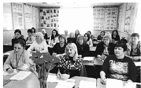
Під час семінару-наради...