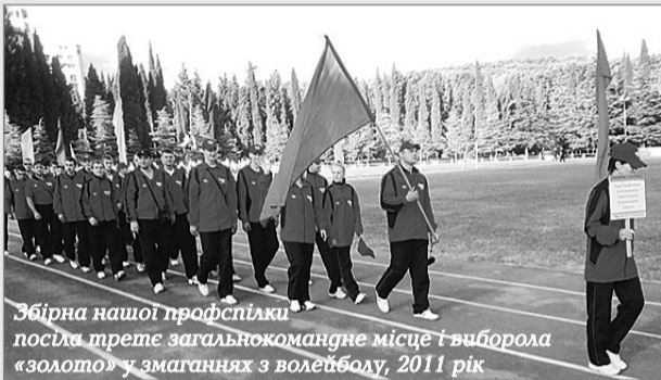
Збірна профспілки після третього загальнокомандного місця і виборота «золото» у змаганнях з волейболу, 2011 рік

Переможці шостої Спартакіади залізничників України взяли участь у Всеукраїнській міжгалузевій спартакіаді працівників промислової сфери і транспорту в Алушті 8–11 вересня.