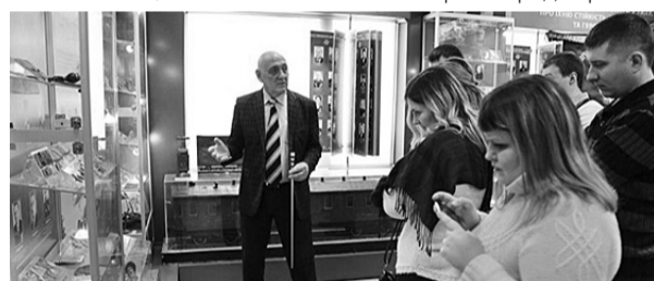
У дорожньому музеї...

Текст і фото Наталії СЕРИХ , провідного фахівця орґвідділу дорпрофсожу Придніпровської залізниці