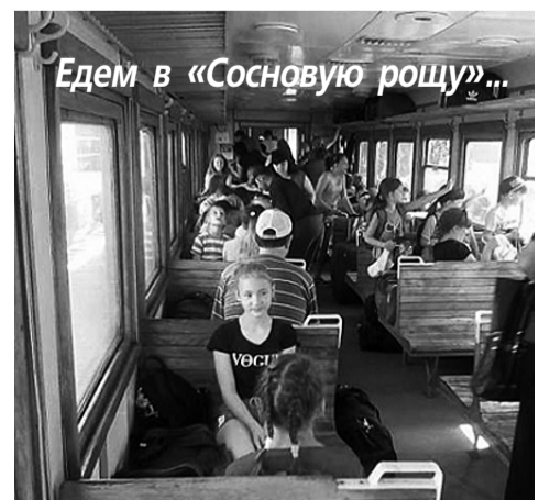
Едем в «Сосновую рощу»...

Продовження теми — у наступному номері «ВІСНИКА»