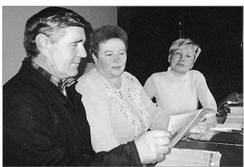
Бути у курсі профспілкових справ спільчанам допомагає «ВІСНИК»...