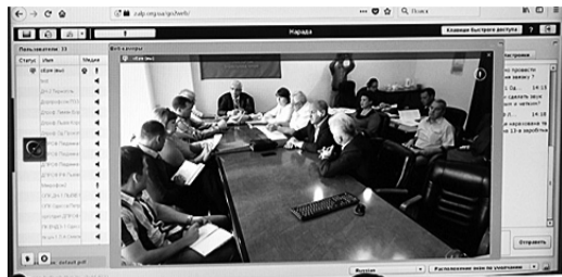
Захід проведено у форматі веб-конференції з підключенням 33 абонентів

НА ЧЕРГОВОМУ засіданні президії Ради профспілки, що заплановано провести 26 липня п. р., розглядатимуться питання про стан виконання чинного законодавства та зобов'язань за колдоговорами з питань охорони праці у філії «Центр будівельно-монтажних робіт та експлуатації будівель і споруд», організацію обліку відпрацьованих годин роботи, дотримання трудового законодавства і нормативних актів ПАТ «Укрзалізниця» з питань застосування контрактної форми трудового договору у філії «Пасажирська компанія» та ін.