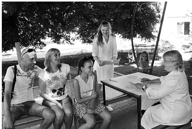
Батьки можуть не хвилюватися: згорів'я юних відпочивальників – у надійних руках кваліфікованих та привітних медичних працівників

Цьогоріч працівники Одеського територіального управління філії «Центр будівельно-монтажних робіт та експлуатації будівель і споруд» своєчасно виконали необхідні ремонтні роботи. Проведено також модернізацію пожежної сигналізації у спальних корпусах.