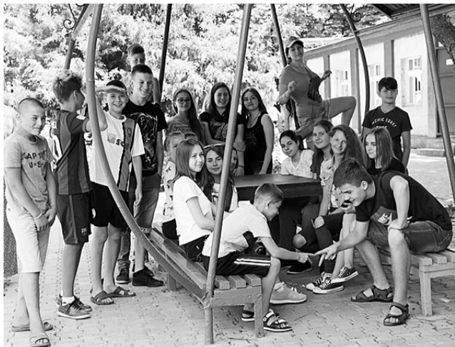
Діти гучно тішаються зустрічі зі старими і новими друзями та вивчені, що перша зміна в оздоровниці – найкраща!