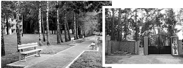
Дорослі докладають багато зусиль, щоб «Зоряка» кожного літа ставала ще гарнішою та привітнішою...