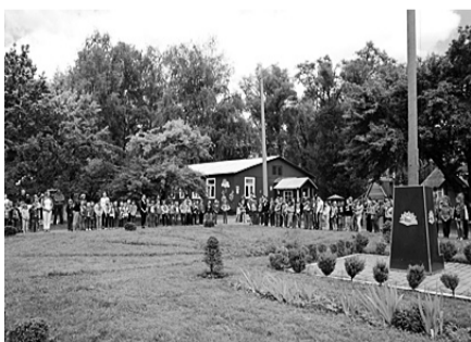
Промайнув час, закінчилась перша зміна: на урочистій лінійці підбито підсумки, нагороджено переможців спортивних змагань, конкурсів тощо, а концертні виступи завжди сприймаються на «ура»...