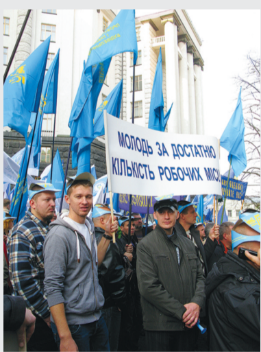
Члени нашої профспілки стали активними учасниками попереджувальної акції протесту під стінами Кабміну, 15 жовтня 2014 р.

Внаслідок здійснення результативного громадського контролю за дотриманням трудового законодавства роботодавцями повернуто працівникам 5,6 млн грн. недоплачених або незаконно утриманих коштів.