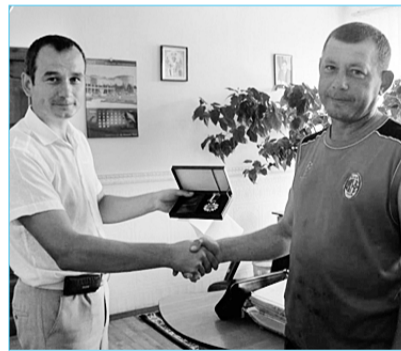
Під час вручення нагороди...

Флаг нашего профсоюза уже развивался над Эльбрусом (5642 м) – наивысшей горой Европы и над самой высокой точкой Украины – горой Говерла (2061 м), о чем «ВІСНИК» сообщал 31 августа и 12 октября 2012 года.