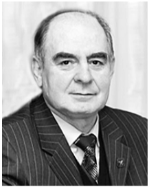
З повагою Вадим ТКАЧОВ , Голова Федерації профспілок транспортників України, Голова профспілки залізничників і транспортних будівельників України

Бажаю вам і вашим родинам миру, злагоди, міцного здоров'я і достатку.