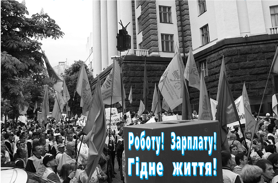
Мітинг біля Кабміну 14 травня 2019 року: перший етап профспікової акції протесту...