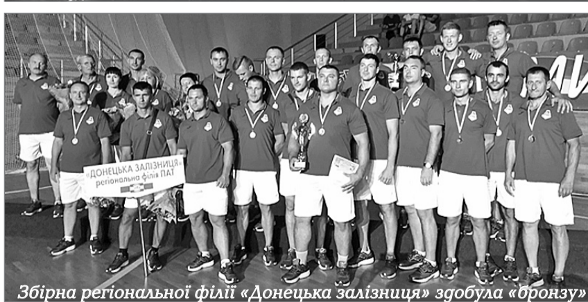
Збірна регіональної філії «Донецька залізниця» здобула «бронзу»