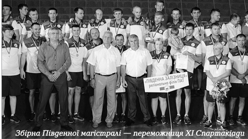
Збірна Південної магістралі – переможниця XI Спартакіади