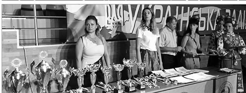
Нагороди XI Спартакіади залізничників...