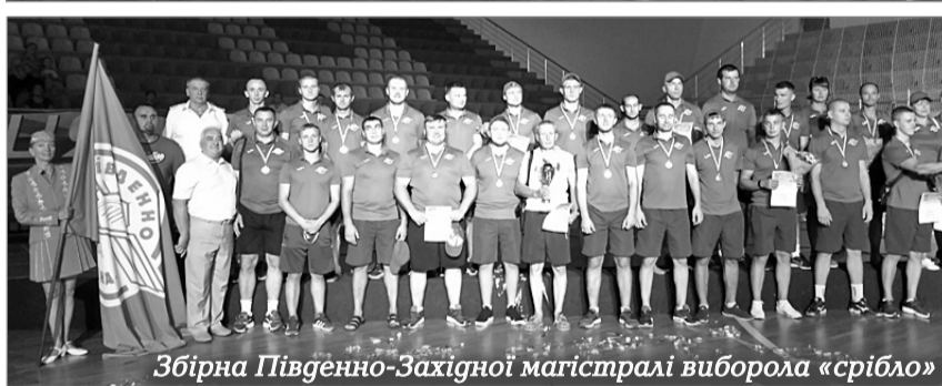
Збірна Південно-Західної магістралі виборола «срібло»