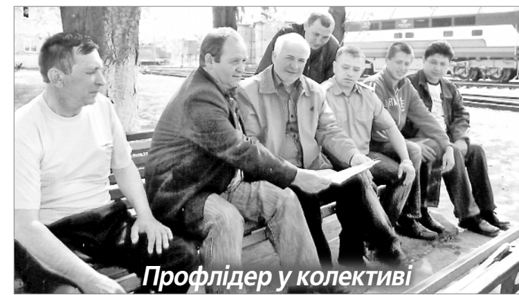
Профлідер у колективі

Минуло чотири роки і головні пункти програми реалізовано. За участі авторитетного голови профкому сьогодні вирішуються виробничі і поза-виробничі проблеми, спілчани йому довіряють, адже профлідер — свій, з