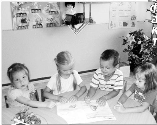
...Яскраво ілюстровану книжку із зацікавленістю розглядають малюки – діти залізничників у херсонському дитсадочку № 87