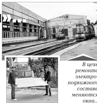
В цехе ремонта электроподвижного состава меняются окна...

Юрий ШВАЙКО, внештатный корреспондент «ВІСНИКА».