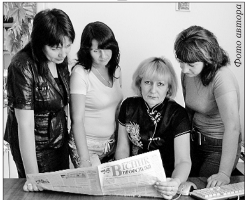
У колективі уважно читають «ВІСНИК», а за кошти профкому передплачують профспілкову газету «Вісник залізничників»