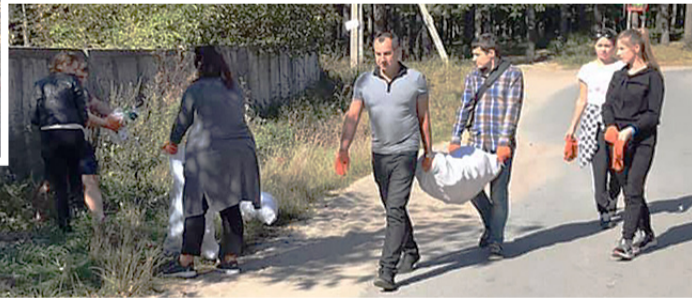
Завдяки нашій молоді у Суховолі стало чистіше