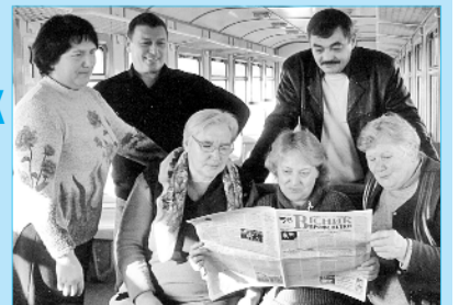
Знімок надіслано на фотоконкурс «Профспілка в дії» Козятинським теркомом

Бажаєте отримувати профспілкову газету – звертайтеся до профкому!