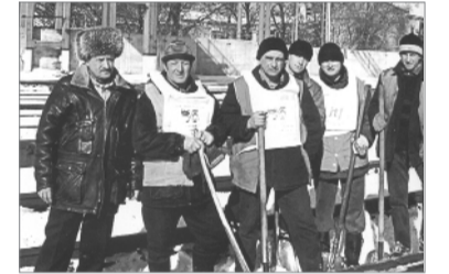
Працівники Одеської дистанції колій у рамках Міжнародного дня дій звертають увагу адміністрації залізничної на забезпечення безпеки робіт на напруженій ділянці ст. Одеса-Головна.