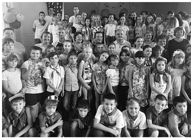
«Сосновий гай» – країна дитинства

«БЕРІЗКА» вже 70 років поспіль оздоровлює дітей залізничників. Щоліта до табору приїжджають відпочивати майже 700 дітей.