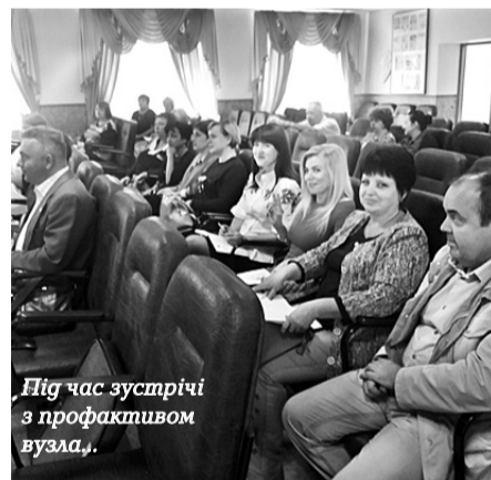
Під час зустрічі з профактивом вузла.

Також поінформували присутніх з актуальних питань сьогодення – про кроки щодо повернення окремим категоріям залізничників пенсії за вислугу років. Особливо наголосив на необхідності підтримки електронної петиції, розміщеної на сайті Кабміну, і про можливість кожного спільчанина відновити свої права, незаконно скасовані Урядом, та захистити своє майбутнє.