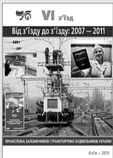
На початку грудня 2011 року видано дві книги — ілюстрований звіт про діяльність Ради профспілки після V з'їзду та до 20-річчя профспілки у незалежній Україні

З'їздом ухвалено ряд звернень до вищого керівництва держави, а також профільного Міністерства та Укрзалізниці щодо гострих проблем, які виникли в галузі, зокрема, про реформування залізничного транспорту, збереження у підпорядкуванні Мінінфраструктури навчальних закладів залізничного транспорту.