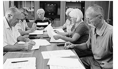
Во время заседания президиума...

На президиуме также рассмотрены вопросы обеспечения молоком и мылом, спецодеждой, спецобувью и другими средствами индивидуальной защиты, состояние