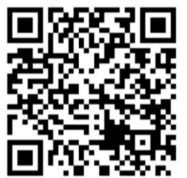
Скануйте і переходьте на фейсбук-сторінку

Нагадаємо, що Друга Міжнародна науково-практична конференція – УКРПРОФЗТ/2021 розпочала свою роботу в День Професійної спілки залізничників і транспортних будівельників України – 1 серпня 2021 р., а підсумки її роботи буде підбито 3 листопада 2021 р. – напередодні Дня залізничника.