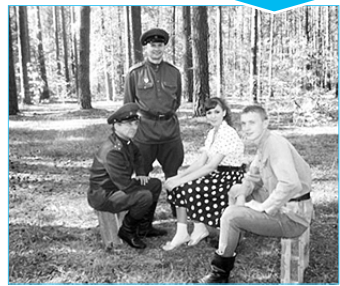
Потії воєнних років «ожили» у лісі – поруч із землянками в музейному комплексі «Лісоград»...