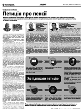
«Магістраль», №37, 29.09 — 5.10.2018 р.