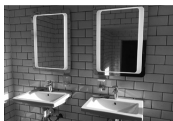
У локомотивному депо Козятин...

За результатами перевірок виробничих та службово-побутових приміщень на місцях, поряд з позитивними тенденціями, зокрема у Київській та Дарницькій дистанціях колії, встановлено, що у виконанні Програми покращення умов праці працівників регіональної філії «Півден-