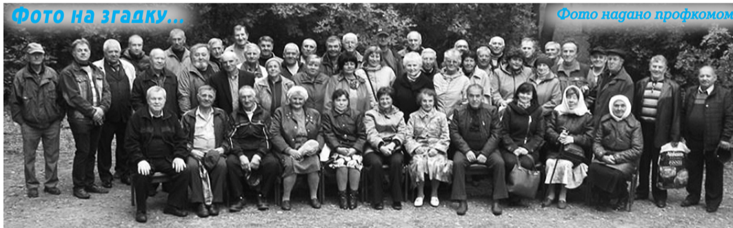
Зустріч у Лиманській дистанції електропостачання регіональної філії «Донецька залізниця»

3 пошти «Вісника» • 03049, Київ, Повітрофлотський проспект, 15 А. E-mail: visnykprof@gmail.com