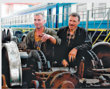
«Щоб не виявилось, що вся реформа системи оплати праці – лише в зміні назви...»

На це, безперечно, впливали й внутрішньо-державні процеси, які викликали справедливе обурення громадян і, зокрема, залізничників.