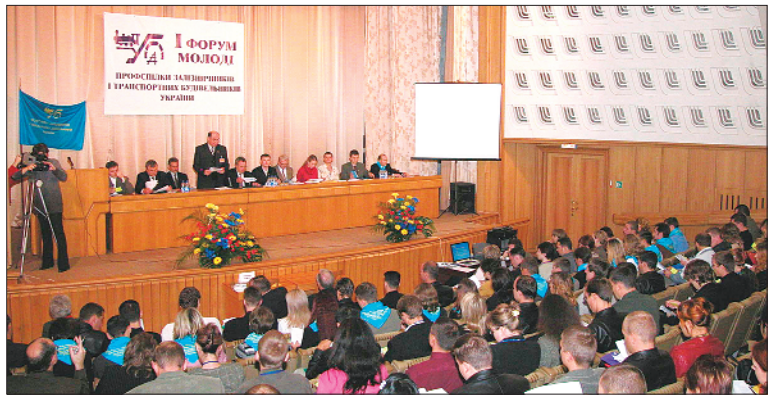
Перший Форум молоді профспілки, 2004 р.

26 листопада на установчій асамблеї профспілок України, у роботі якої взяли участь делегати від 12 всеукраїнських профспілок, створено