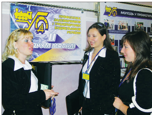
Молоді профактивісти – учасники II Форуму

Із 1127 первинних профорганізацій структурних підрозділів у 850 створено молодіжні ради.