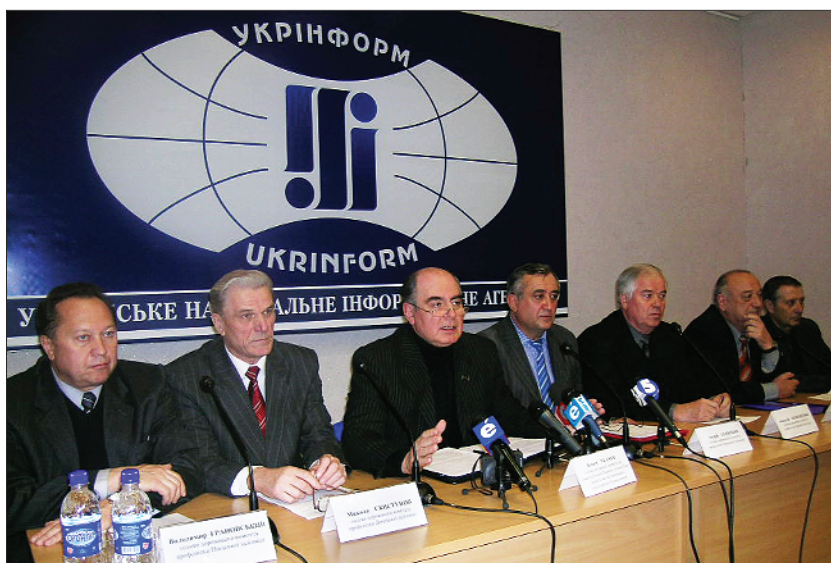
Прес-конференція в «Укрінформі», 2005 р.

У Красному Лимані проходили змагання з легкої атлетики, плавання, волейболу, гирьового спорту, армрестлінгу і шахів. У Спартакіаді брали участь 130 спортсменів-залізничників, серед яких були майстри спорту міжнародного класу, України, кандидати у майстри спорту, першорядники. Унікальність II Спартакіади полягала у тому, що її учасниками були залізничники різних професій.