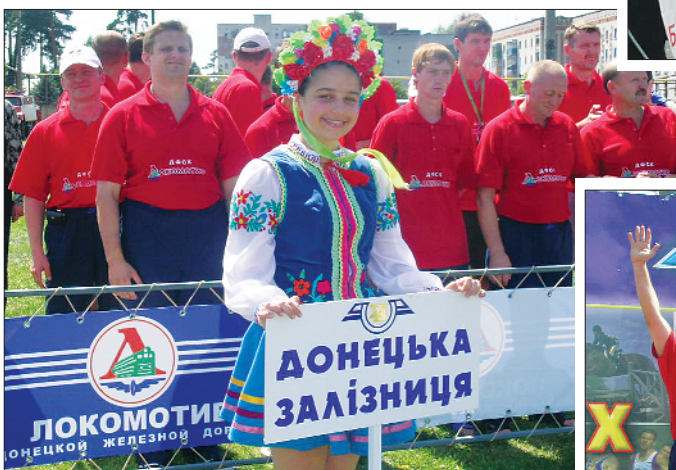
Перше місце виборола збірна команда Донецької залізниці, друге – Одеської, третє – Південної.