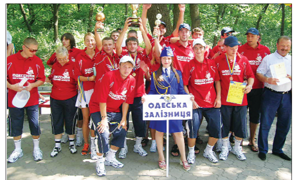
Переможці III Спартакіади – збірна команда Одеської залізниці

5–6 серпня пройшла III Спартакіада трудових колективів залізниць.