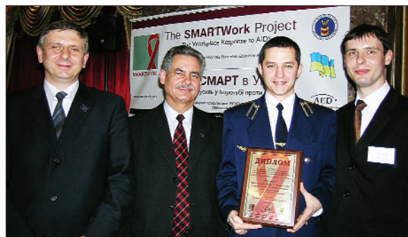
За результатами конкурсу «Спільними діями – у здорове майбутнє» Раду профспілки нагороджено відзнакою і дипломом

Завершилася робота фахівців Ради профспілки у рамках проекту SMART щодо профілактики ВІЛ/СНІДу на робочих місцях.