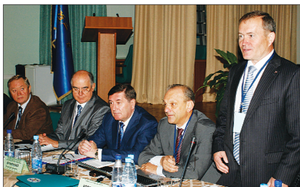
Під час роботи V міжнародної регіональної конференції: виступає Голова Міжнародної конфедерації профспілок залізничників, Голова Російської профспілки залізничників і транспортних будівельників М.НІКІФОРОВ. Одеса, вересень 2009 р.

Вперше 25–28 вересня 2009 року в Одесі на V регіональній конференції профспілок транспортників наша профспілка збрала представників трьох міжнародних організацій для опрацювання тем, пов'язаних із проблемами розвитку профспілок транспортників у сучасних умовах, та для пошуку шляхів їх вирішення.