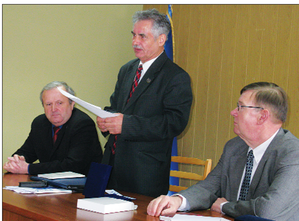
Виїзний день Ради профспілки на залізничному вузлі Попасна Донецької магістралі, 2010 р.

залізниці відбувся виїзний день Ради профспілки. Фахівці зустрілися з профактивом вузла, відповіли на запитання спілчан, надали консультації щодо захисту їхніх трудових прав.