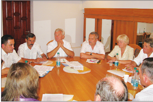
Засідання профсекції працівників господарства приміських пасажирських перевезень, 2011 р.

Вперше склад секцій сформовано до з'їзду, голів секцій делеговано до складу Ради профспілки.