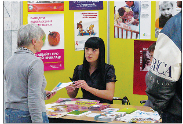
Спільна акція профспілки та Державної соціальної служби для сім'ї, дітей та молоді під гаслом «НІ – насиллю!» пройшла більше ніж на 160 залізничних вокзалах. Вокзал Київ-Пасажирський, 28 жовтня 2009 р.

Працівники та волонтери соціальних служб надавали інформацію та консультували з психологічних, медичних, юридичних питань пасажирів та працівників залізничного транспорту. Профспілка взяла участь у Всеукраїнському фестивалі соціальних проектів, представивши позаконкурсний проект «Заради майбутніх поколінь».