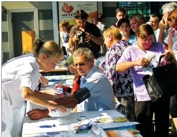
Соціальна акція «День здоров'я» на вокзалі Київ-Пасажирський Південно-Західної залізниці, 2011 р.

Працівники та пасажир залізничного транспорту отримували медичні консультації та корисні поради з приводу відповідального ставлення до свого здоров'я.