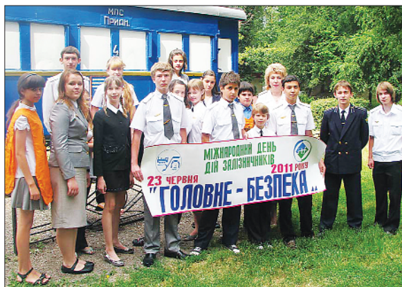
До міжнародної акції долучилася Придніпровська дитяча залізниця

23 червня проведено Міжнародний день дій залізничників МФТ. Пройшли інформаційні акції, комісійні огляди, лекції, «круглі столи» тощо за активної участі профорганізацій усіх рівнів на залізницях України.