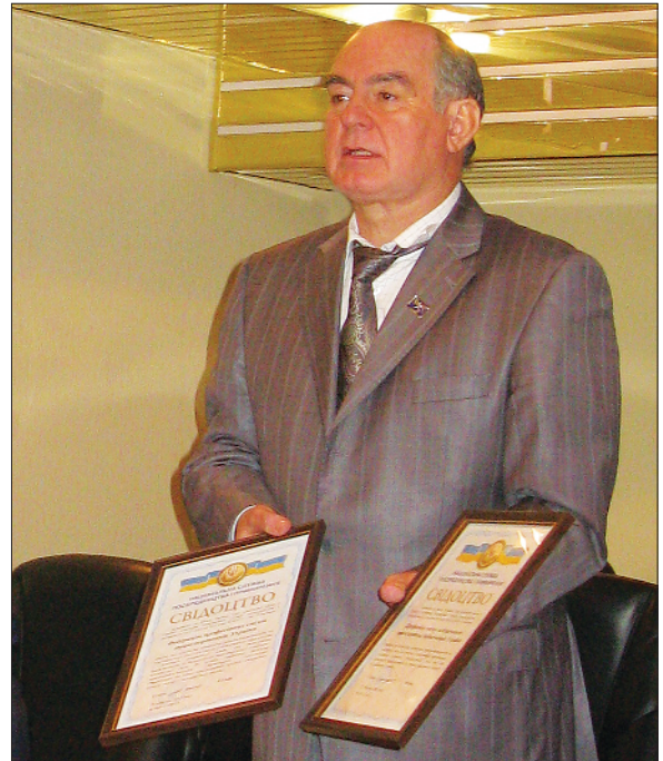
Свідоцтва про репрезентативність ФПТУ і профспілка залізничників і транспортних будівельників отримали 22 вересня 2011 р.

У 2011 році Федерація профспілок транспортників України і профспілка залізничників і транспортних будівельників довели свою репрезентативність , тобто відповідність усім вимогам, які висуває Закон України «Про соціальний діалог».