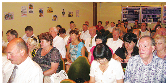
Нарада з головами первинних і цехових профорганізацій пасажирських вагонних депо і дільниць з приводу запровадження автоматизованої системи формування поїзних бригад, 2011 р.

Спеціалістами Головного інформаційно-обчислювального центру Укрзалізниці розроблено автоматичну систему формування поїзних бригад, що викликало широкий резонанс серед працівників пасажирського господарства. Рада профспілки провела нараду з метою врегулювання проблемних питань при запровадженні цієї системи, вказавши, що у заробітній платі ніхто із працівників не постраждає, а навпаки, 80 % матимуть її підвищення.