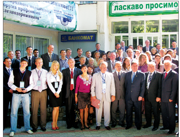
Учасники II Міжнародного молодіжного форуму МКПЗ, 2010 р.

Прошли солідарні заходи у рамках Всесвіт-