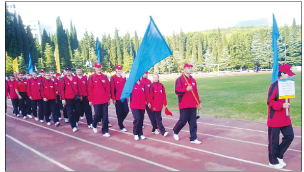
Збірна команда профспілки на Всеукраїнській міжгалузевій спартакіаді виборолала «бронзу», 2011 р.

У Всеукраїнській міжгалузевій спартакіаді працівників промислової сфери і транспорту збірна команда профспілки посіла третє місце і виборолала «золото» у змаганнях з волейболу.