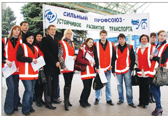
Акція до Міжнародного дня дій залізничників на Донецькій магістралі, 2010 р.

13 квітня 2010 року проведено Міжнародний день єдиних дій залізничників МФТ під гаслом «Міцна профспілка – стійкий розвиток транспорту!». До заходів активно долучилися профорганізації усіх рівнів: надавалися консультації членам профспілки, проведено збори, наради, зустрічі з трудовими колективами і профактивом, перевірено стан забезпечення прав і соціальних гарантій жінок у рамках оголошеного Радою профспілки року.