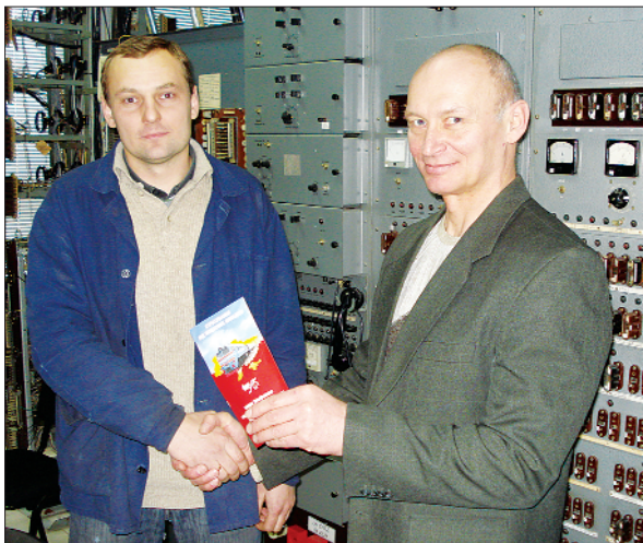
Вручення свідоцтв про страхування членів профспілки від нещасних випадків на виробництві у Харківському метрополітені

До профільних комітетів Верховної Ради України, Кабінету Міністрів України, Спільного представницького органу профспілок від імені профспілки залізничників і транспортних будівельників надіслано більше ніж 60 пропозицій до проектів 25 законодавчих актів.