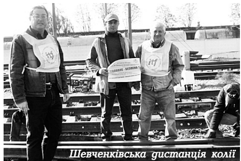
Шевченківська дистанція колії

ШЕВЧЕНКІВСЬКИЙ терком профспілки провів у режимі відеоконференції інформаційний день для голів первинок Христинівського та Гайворонського вузлів. На захист трудових прав працівників проведено 243 перевірки.