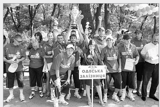
Переможці III Спартакіади – збірна команда Одеської залізниці

5–6 серпня пройшла III Спартакіада трудових колективів залізниць.