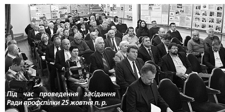
Під час проведення засідання Ради профспілки 25 жовтня п. р.

Профспілка звернулася за солідарною підтримкою до Міжнародної федерації транспортників, Міжнародної конфедерації профспілок залізничників та інших організацій.