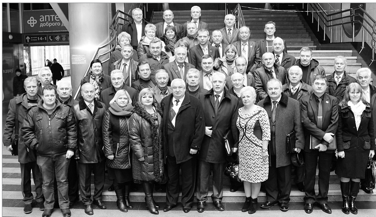
Члени Раги профспілки у 2011–2016 роках