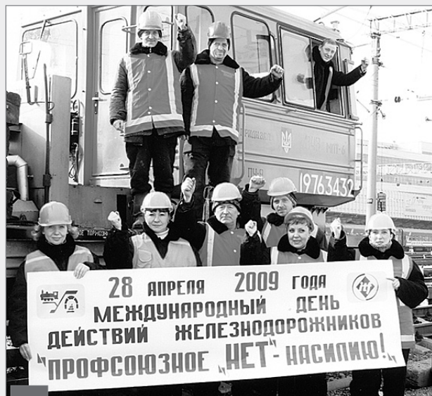
Учасники міжнародної акції – працівники Дніпропетровської дистанції колії

У квітні пройшов Міжнародний день дій залізничників МФТ під гаслом «Профспілкове «НІ» – насиллю!», під час його проведення звернуто увагу на недопущення несанкціонованого втручання в роботу залізничного транспорту та запобігання насиллю стосовно персоналу тощо.