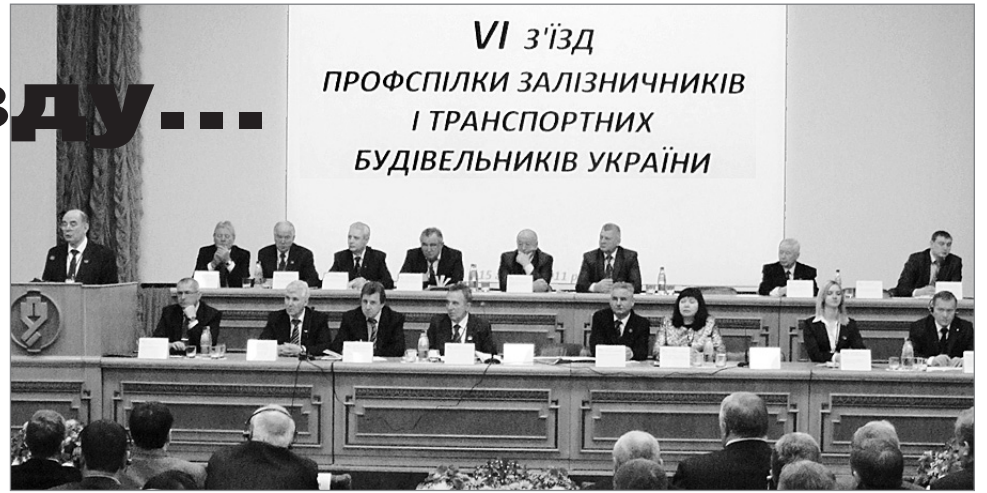
VI з'їзд ПРОФСПІЛКИ ЗАЛІЗНИЧНИКІВ І ТРАНСПОРТНИХ БУДІВЕЛЬНИКІВ УКРАЇНИ

Створено первинну профорганізацію Публічного акціонерного товариства «Українська залізниця».