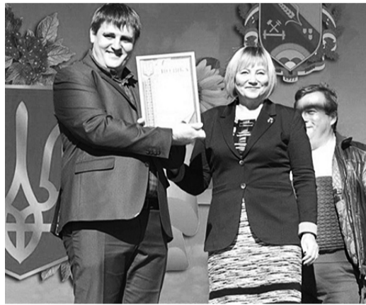
Під час вручення нагород...

Під час святкування з нагоди Дня залізничника почесними грамотами та грошовими преміями за сумлінну працю було відзначено наших профактивістів. Нагороди в номінаціях «Ветеран праці», «Гордість залізниці» та «Майбутнє залізниці» їм вручили голови первинок.