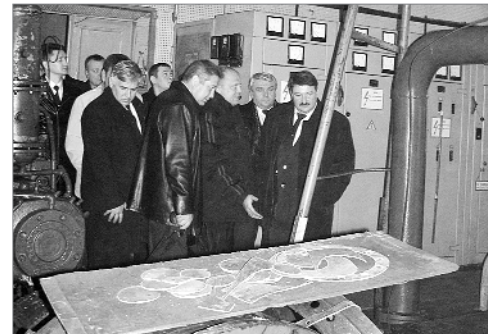
Члены дорожной комиссии в компрессорной Днепропетровской дистанции сигнализации и связи на станции Верховцево

стрелочных переводов станций. Впрочем, работа не приостанавливается, так что зимаревизор проверит, а железнодорожники оценят, насколько ответственно подо-