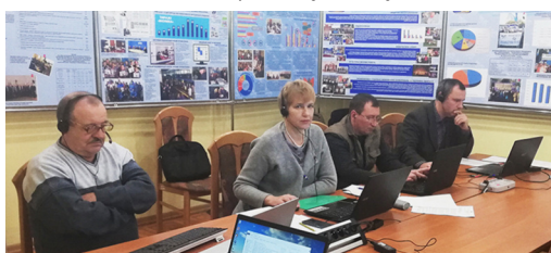
Під час засідання Ради профспілки 26 листопада 2020 року

У газеті «Вісник профспілки» висвітлюватиметься стан виконання норм Галузевої угоди.