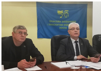
Затвердження постанов Ради профспілки відбувалося за допомогою відеоголосування та відеопроколювання

За підсумками розгляду питання ухвалено постанову, текст якої опубліковано на сайті www.zalp.org.ua .