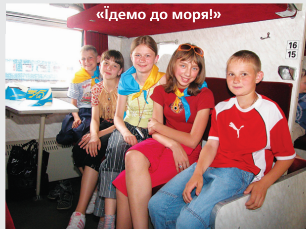
«Ідемо до моря!»

Тому Рада профспілки звернулася до керівництва Укрзалізниці з пропозицією терміново вжити невідкладних заходів для виправлення становища.