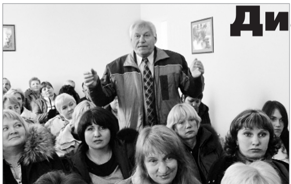
Зал на вопросы не скупился...

«День трудового права» с участием специалистов дорпрофсожа и ряда служб Приднепровской магистрали состоялся в дистанции пути Запорожье II. Более 80 железнодорожников получили консультации и разъяснения по конкретным вопросам