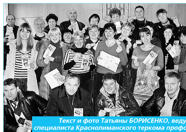
Текст и фото Татьяны БОРИСЕНКО, ведущего специалиста Краснолиманского теркома профсоюзу