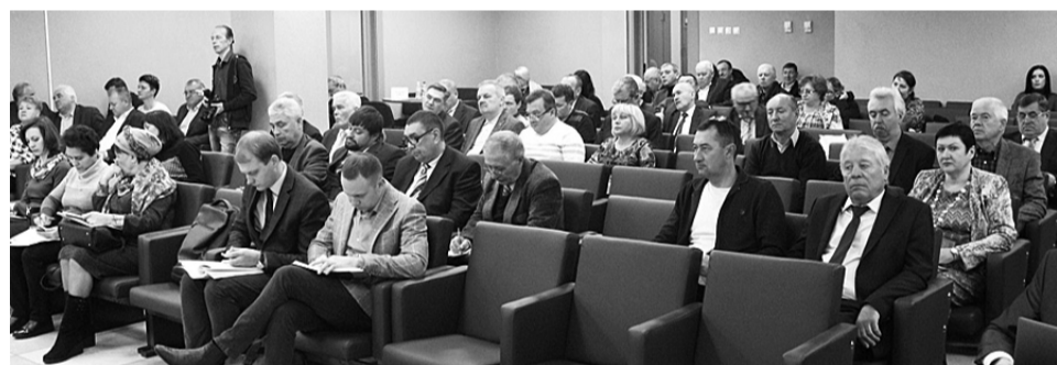
Під час засідання Ради профспілки...

На засіданні ухвалено постанови з розгляду питань