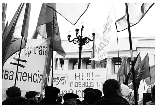
Всеукраїнська акція протесту профспілок 23 грудня 2014 року

рівнів, у т. ч. Всеукраїнській акції протесту, численним зверненням до парламентських комітетів, фракцій, широкомасштабній інформаційно-роз'яснювальній роботі, оперативному реагуванню на кожну урядову ініціативу, вдалося не тільки не допустити прийняття низки норм, якими передбачався значний наступ на права громадян, а й дещо пом'якшити окремі запропоновані Урядом антисоціальні міри.