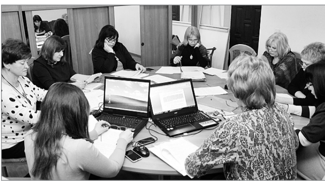
із роз'ясненнями Державної фіскальної служби України.

Запропоновано внести зміни та доповнення до Положення про централізоване бухгалтерське обслуговування профспілкових організацій згідно