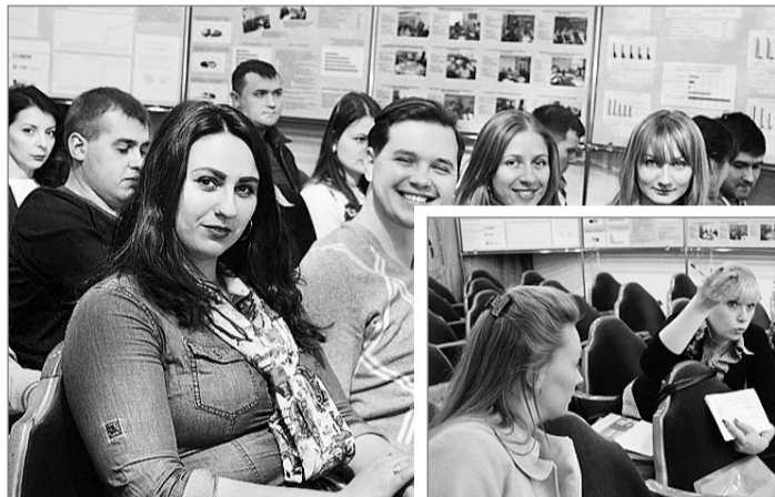
Члени Молодіжної ради профспілки...