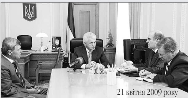
21 квітня 2009 року

Під час зустрічі 21 квітня Голови Верховної Ради Володимира Литвина з керівниками профспілок, які діють у галузі, обговорено реформування залізничного транспорту і висловлено думку, що це питання має вирішуватися на законодавчому рівні, а не шляхом прийняття рішень, наказів та постанов виконавчої влади.