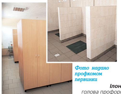
Фото нагано профкомом первинки

стернях, санітарно-побутовому корпусі, «теплому переході» від нього до вагоноскладального цеху, що тепер дає можливість працівникам комфортно працювати на своїх робочих місцях. Також, вперше за останні 25 років, було повністю оновлено «обличчя» депо – головний в'їзд на його територію.