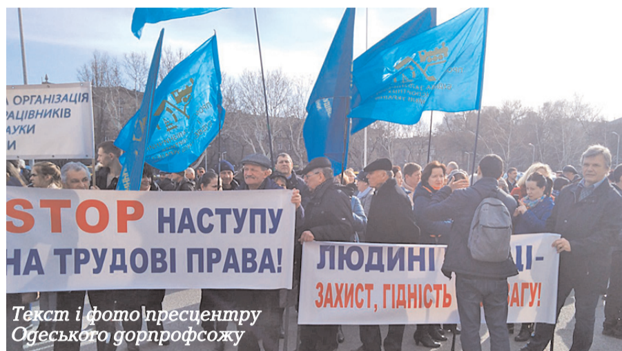
Текст і фото пресцентру Одеського дорпрофсожу

Наше рішуче « STOP! » — антинародному законопроекту № 2708