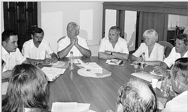
Засідання профсекції працівників господарства приміських пасажирських перевезень, 2011 рік

Вперше склад профсекцій було сформовано до з'їзду, а голів профсекцій делеговано до складу Ради профспілки.