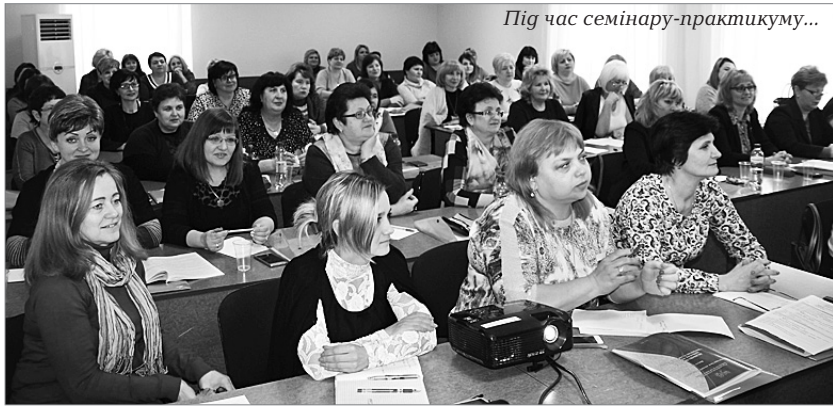
Під час семінару-практикуму...

НА БАЗІ навчально-методичного центру федерації проф-організації Чернігівської області (ФПУ) 14-16 березня Рада профспілки провела семінар-нараду фінансових працівників з питань організації і методології бухгалтерського обліку та введення оновленої облікової політики в профспілці. У заході взяли участь фінансові працівники дорожніх, територіальних, об'єднаних та первинних профорганізацій.