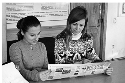
Спілчани — працівниці групи обліку Дніпровського локомотивного депо у 2019 році — з «ВІСНИКОМ»...