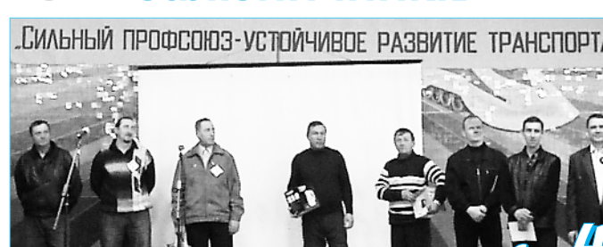
Лучшие общественные инспекторы труда Славянского узла

У цей день у рамках акції фахівці апарату Ради профспілки провели зустріч з активом Попаснянського залізничного вузла, а також надали спілчанам консультації щодо захисту їхніх трудових прав