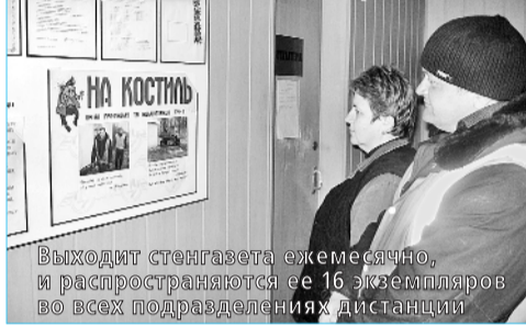
Виходить стенгазета ежемесячно, и распространяются ее 16 экзemplяров во всех подразделениях дистанции

оторванні кармани, замасленні захисні жилети без пуговиць... Такі «герої» і потрапили в об'єктив фотоапарата. В другому номері профактивисти показали, як на одному із околотов, де к тому ж недавно був зроблений ремонт, замість полотенця використовують... оконні штори. «Накостыляет» газета, якщо надо, і п'яничкам, і прогульщикам, і лентяям! Кожен новий номер публікує щось цікаве і корисне. Трепетом: кому хочеться «прославитися»? Потому і спешат исправити недоліки і недочеты, укріпити трудову дисципліну.