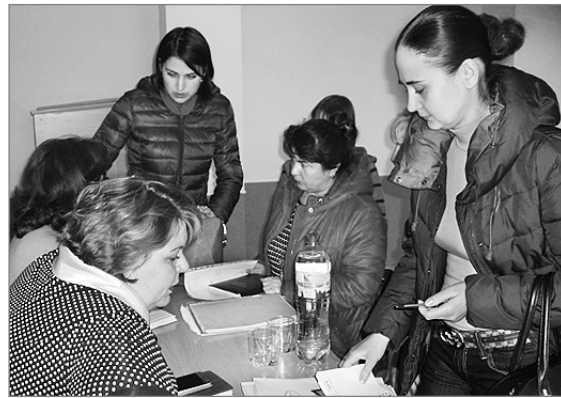
Під час спілкування з членами профспілки...

● кондитерська «Самомиле» ( https://samomille.com.ua ) – знижка 5 % на десерти (крім акційних пропозицій), 10 % – на торти (крім «економічних» і акційних пропозицій) і паски, 50 % – на доставку десертів і тортів (вагою до 4 кг) в «умовний центр» (вказаний на сайті кондитерської).