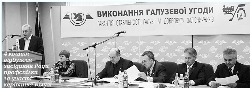
4 квітня відбулося засідання Ради профспілки за участі керівника галузі