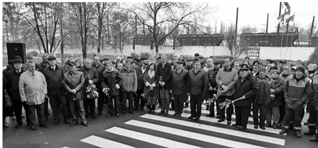
Під час мітингу пам'яті В.М.Ткачова

В ПАМ'ЯТЬ про Голову профспілки залізничників і транспортних будівельників України Вадима Мар'яновича ТКАЧОВА, який зробив величезний внесок у розвиток профспілкового руху в Україні, 16 квітня п. р. відбулося урочисте відкриття меморіальної дошки. Вона встановлена на фасаді адміністративної будівлі експлуатаційного вагонного депо Одеса-Застава І регіональної філії «Одеська залізниця».