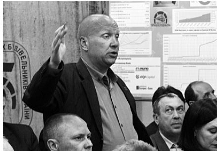
Під час засідання профсекції...

логії та професійні захворювання машиністів та їх помічників під дією несприятливих виробничих чинників.