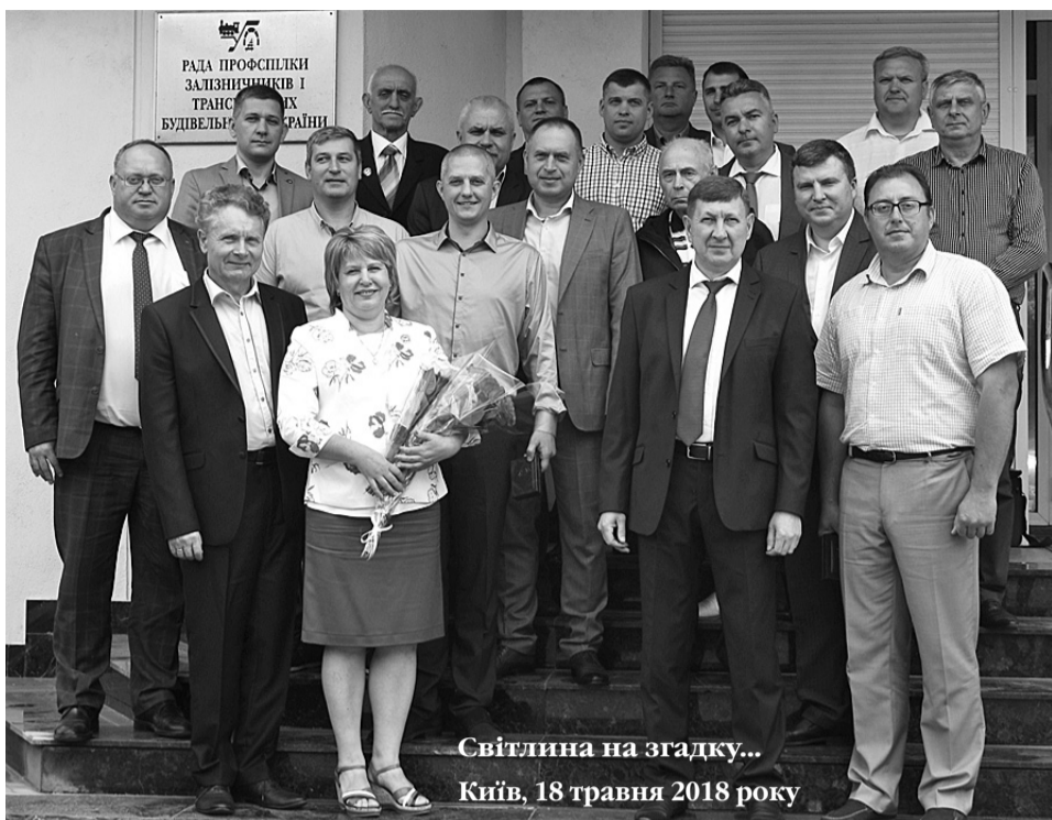
Світлина на згадку... Київ, 18 травня 2018 року

Загалом за підсумками роботи технічної інспекції праці Ради профспілки за останні 10 років працівникам повернуто понад 1,8 млн грн.