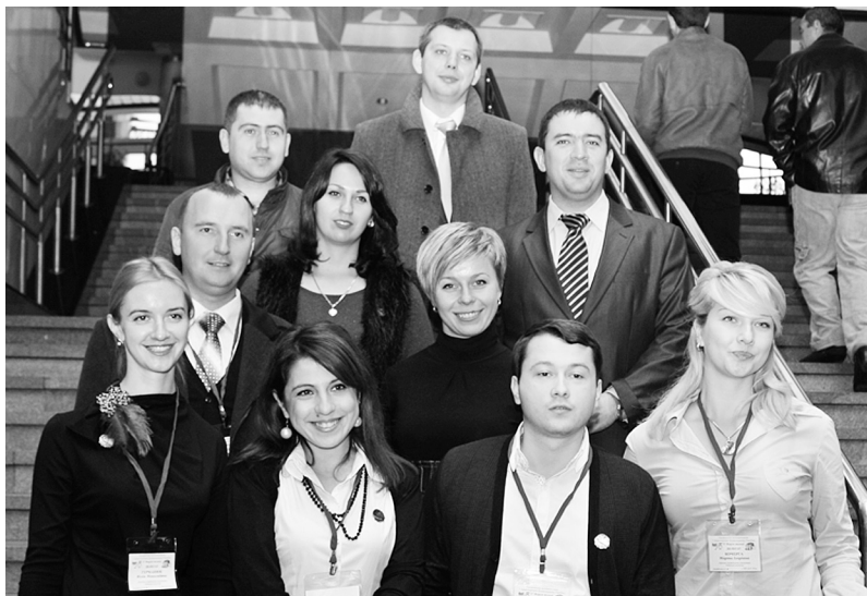
Делегати ІV Форуму профспілки, 2013 р.

МОЛОДІ, ШАСЛИВИ, СИЛЬНІ – МИ У СПІЛЦІ ПРОФЕСІЙНІЙ