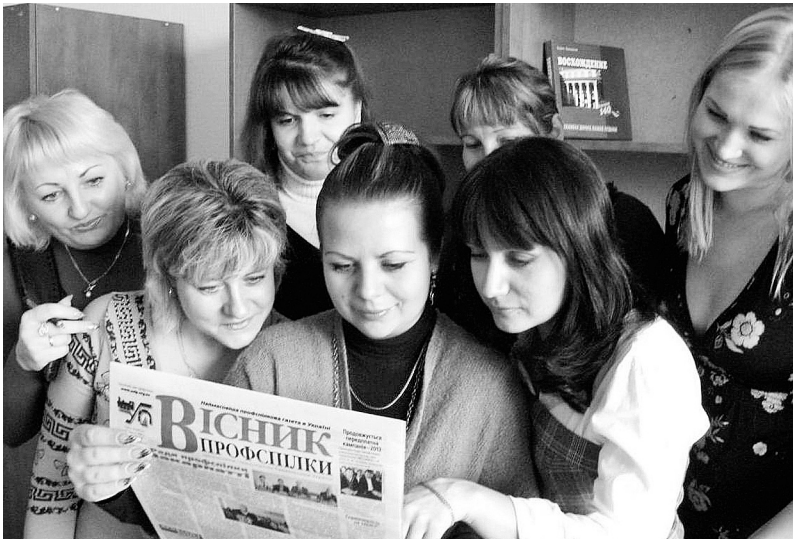
Молоді активісти із Дебальцевого

Із задоволенням реалізує молодь і «журналістський» потенціал: замітки молодих спілчан друкуються у дорожній і профспілковій газетах, вісниках профорганізацій, розміщуються на стендах.