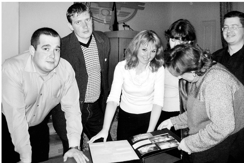
Активісти Одеської дорожньої профорганізації

МОЛОДІ, ЩАСЛИВІ, СИЛЬНІ – МИ У СПІЛЦІ ПРОФЕСІЙНИЙ