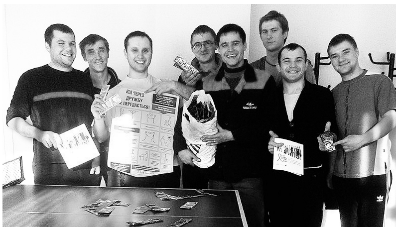
Учасники акції «За здоровий спосіб життя». Вагонне депо Одеса-Застава I, 2013 рік

МОЛОДІ, ЩАСЛИВІ, СИЛЬНІ – МИ У СПІЛЦІ ПРОФЕСІЙНІЙ