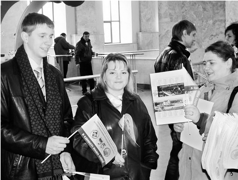
Молоді активісти дорожньої профорганізації – учасники акції

Зокрема, щороку до Дня боротьби зі СНІДом на вокзалі Харків-Пасажирський активісти молодіжної ради дорожньої профоргані-