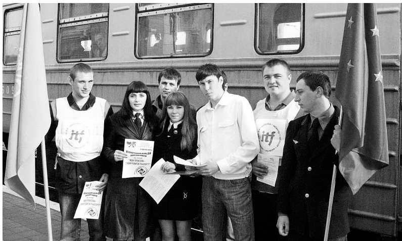
Учасники Міжнародного дня дій залізничників

МОЛОДІ, ЩАСЛИВІ, СИЛЬНІ – МИ У СПІЛЦІ ПРОФЕСІЙНІЙ