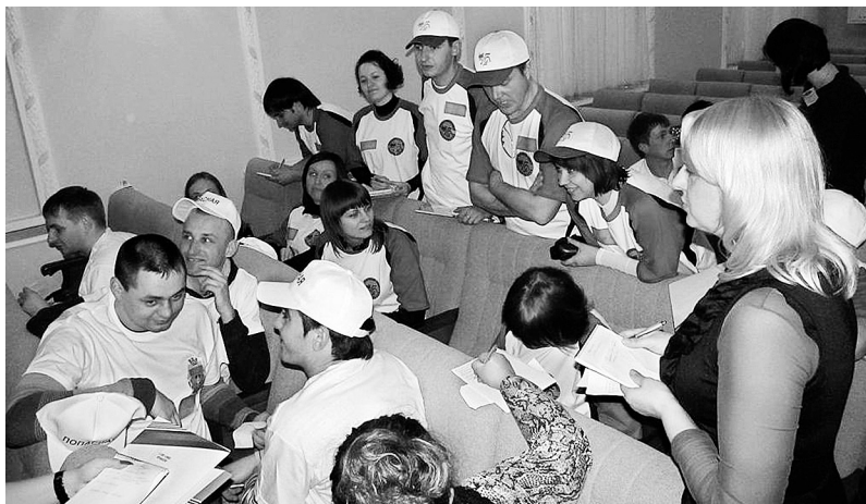
Навчання в роботі допомагає...

Тож ці десять років довели, що до молодіжного профспілкового руху на Донецькій залізниці приєднуються небайдужі юнаки і дівчата, які прагнуть позитивних змін і розвитку, і готові власними руками будувувати у галузі дієву систему соціального захисту.