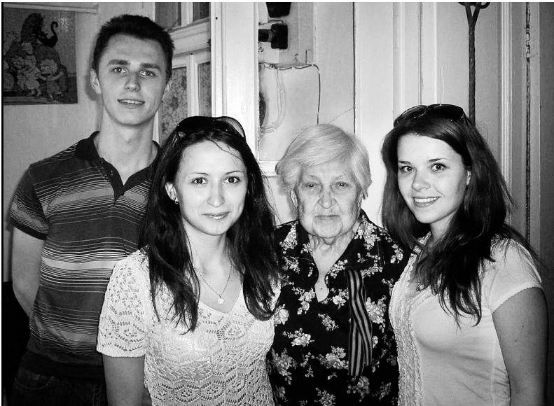
Молоді активісти часто відвідують ветеранів, допомагають і спілкуються з ними. Одеса, 2014 рік

Так, перш за все, для оптимізації роботи «молодіжки» було запропоновано створити робочі групи за головними напрямками діяльності: соціально-правовий захист, організаційна діяльність, інформаційна робота, спортивні та культурно-масові заходи. Була запропонована нова методика роботи молодіжної ради, згідно з якою на кожну з робочих груп покладалися певні завдання з