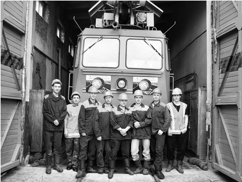
Спілчани первинки Харківської дистанції електропостачання

На засіданнях молодіжної ради дорожньої профорганізації, які відбуваються мінімум раз на півроку, розглядаються найрізноманітніші питання, які цікавлять молодь: правовий захист і охорона праці, проблеми, пов'язані з виробничою діяльністю, професійне зростання, організація культурно-масових і спортивних заходів тощо. Одне з гострих питань, якому молодіжна рада приділяє увагу останнім часом – попередження втрати кваліфікації молодими працівниками з вищою освітою, які працюють на робітничих посадах, забезпечення зайнятості і дотримання трудових прав молодих спілчан, участь у дисконтній програмі профспілки та її розвитку.