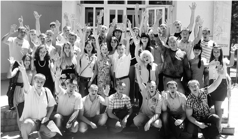
Делегати дорожньої звітно-виборної конференції молоді, 2013 рік

Профкоми структурних підрозділів також уважно стежать за роботою молодших колег, стараються залучати їх до профспілкової роботи. Наприклад, профком інформаційно-обчислювального центру Одеської залізниці в 2010 році звернув увагу, що молодіжна рада первинки працює аж надто формально, і вказав на це на молодіжних зборах, запропонувавши подумати, як можна виправити ситуацію. Молодь дослухалася до поради: на допомогу своєму молодіжному лідеру обрала новий склад молодіжної ради. Робота і справді активізувалася.