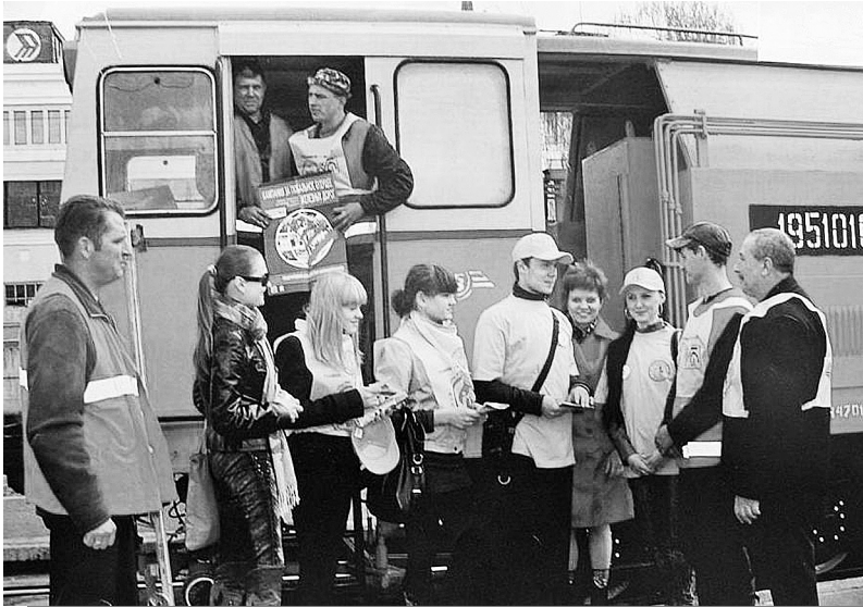
Учасники Дня єдиних дій залізничників

Емоційністю та завзяттям відрізнялися виступи молодих активістів і на установчих конференціях в інших регіонах. Зокрема, харків'яни наполягали на посиленні контролю профкомів за умовами праці та виробничого побуту молодих залізничників.