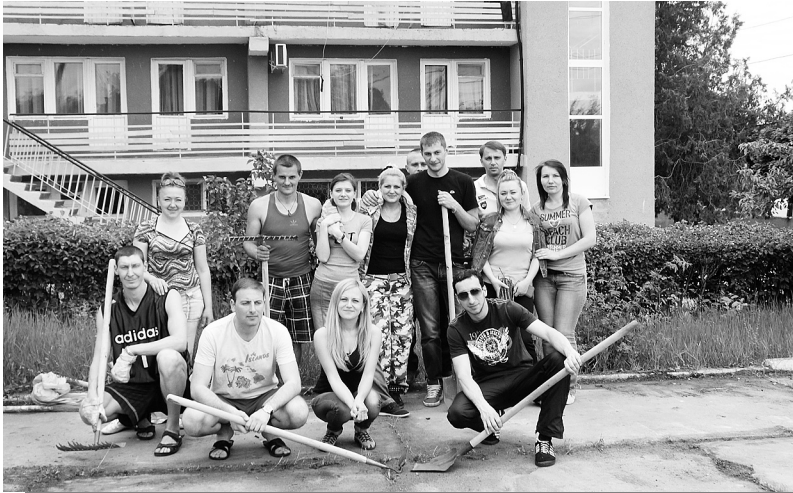
На суботнику в дитячому оздоровчому таборі «Чемпіон», 2014 рік

МОЛОДІ, ЩАСЛИВІ, СИЛЬНІ – МИ У СПІЛЦІ ПРОФЕСІЙНІЙ