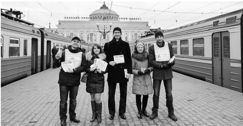
Учасники акції до Всесвітнього дня боротьби із ВІЛ/СНІДом. Одеса, 2013 рік

Наприклад, у 2011 році члени молодіжної ради Знам'янської територіальної профорганізації протягом тижня проводили інформаційну кампанію в первинках структурних підрозділів, разом з фахівцями соціальної служби відвідали місцеві профтехучилище № 12 і профліцей № 3, а 1 грудня вийшли на вулиці міста і провели просвітницьку роботу серед жителів.