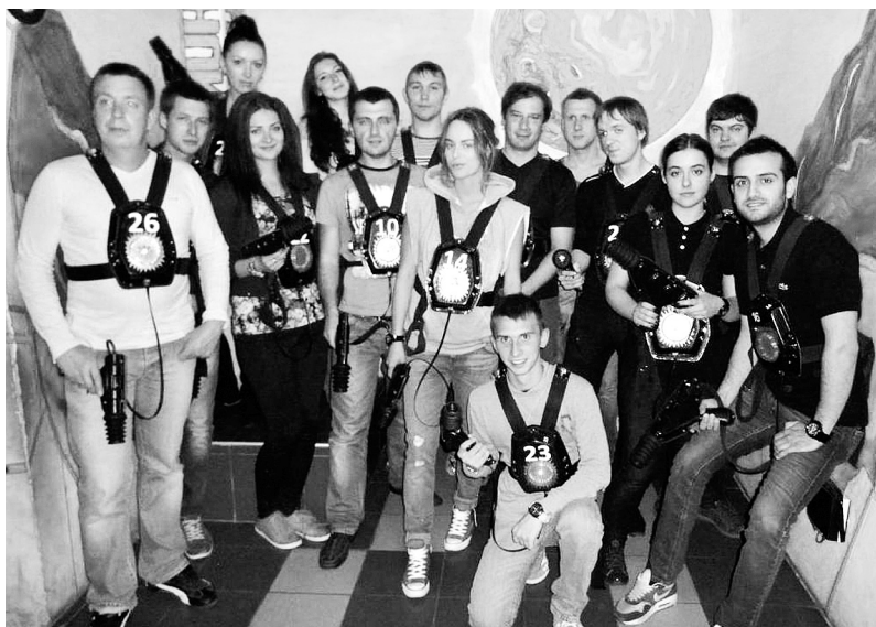
Лазерна гра. Активісти інформаційно-обчислювального центру Одеської залізниці, 2014 рік

МОЛОДІ, ШАСЛИВИ, СИЛЬНІ – МИ У СПІЛЦІ ПРОФЕСІЙНИЙ