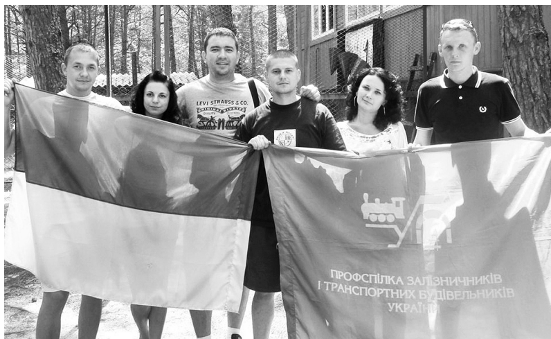
Фестиваль молодих активістів Рівненської територіальної профорганізації до Дня молоді та Дня Конституції України, 2014 рік