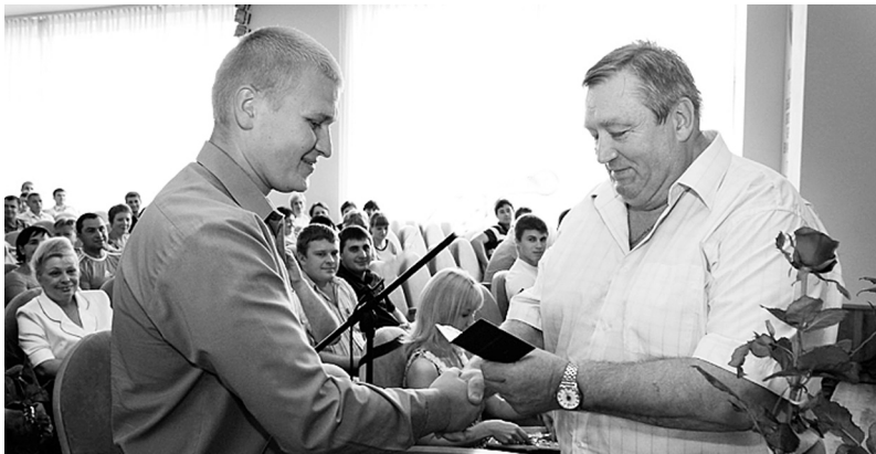
Урочистий прийом у члени профспілки

Низка проблем, до яких молодіжні ради намагаються привернути увагу керівництва залізниці і галузі, стосуються працевлаштування молоді на посади, що відповідають здобутому кваліфікаційному рівню освіти, проходження виробничої практики студентами вишів залізничного спрямування, підвищення престижності професії залізничника, кар'єрного зростання молодих працівників і, звісно, забезпечення молодих працівників житлом і дотримання їх трудових прав та інтересів.