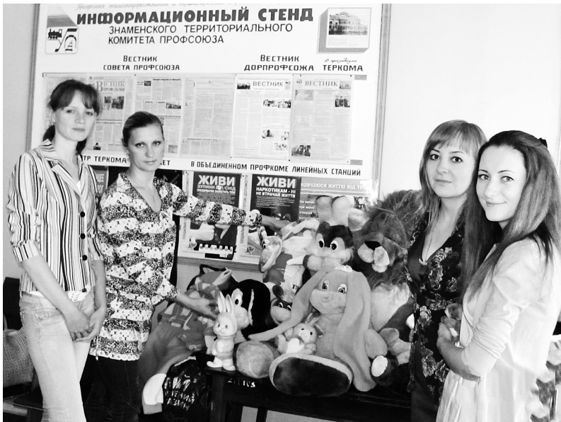
Учасники акції до Дня захисту дітей. Знам'янка, 2014 рік

Із задоволенням проводить молодь екологічні та інші корисні акції. І підходить до їх реалізації з вигадкою.