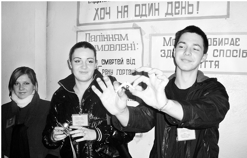
Акція «День без куріння»

Викорінення у молоді згубних звичок і популяризація здорового способу життя – одне із завдань, яке поставили перед собою молодіжні ради.