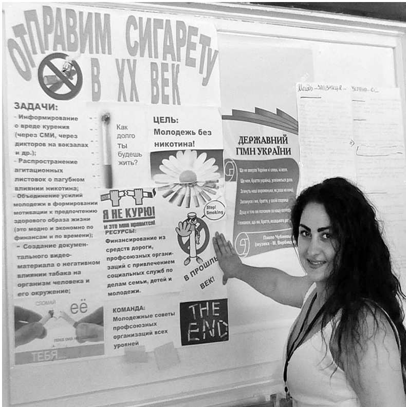
Пропаганда здорового способу життя — одне із завдань молоді

У продовження співпраці з міжнародною громадською організацією «Соціальні ініціативи з охорони праці та здоров'я» після Донецької залізниці почалося впровадження проекту з профілактики ВІЛ/СНІДу серед працівників Львівської залізниці.