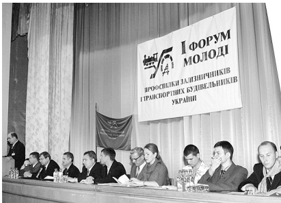
Київ, 2004 р.

Участь у заході взяли 120 делегатів – представників залізниць, промислових підприємств, навчальних закладів.