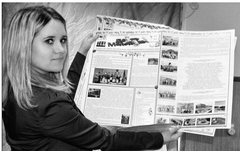
У багатьох профорганізаціях молодь видає власні інформаційні вісники

МОЛОДІ, ЩАСЛИВІ, СИЛЬНІ – МИ У СПІЛЦІ ПРОФЕСІЙНИЙ