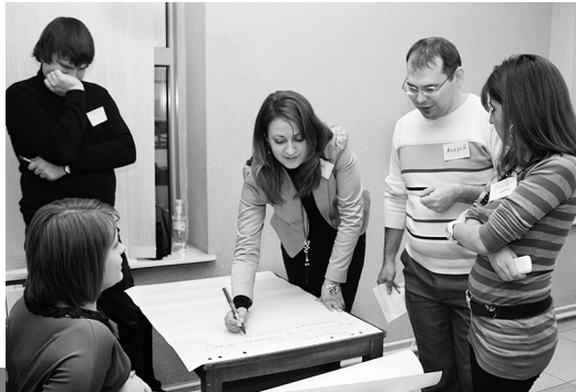
Семінар-навчання щодо розвитку ПНПФ «Магістраль», Київ, 2014 р.

У семінарі-наradі для відповідальних осіб за здійснення заходів щодо розвитку галузевого пенсійного фонду «Магістраль», який 16 січня 2014 року провели Рада профспілки спільно з Укрзалізницею, взяли участь молодіжні лідери.