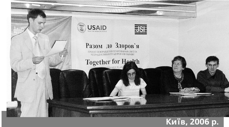
Київ, 2006 р.

Розгорнулася активна робота з формування волонтерського руху. Розпочато співпрацю з міжнародним проектом «Разом до здоров'я».