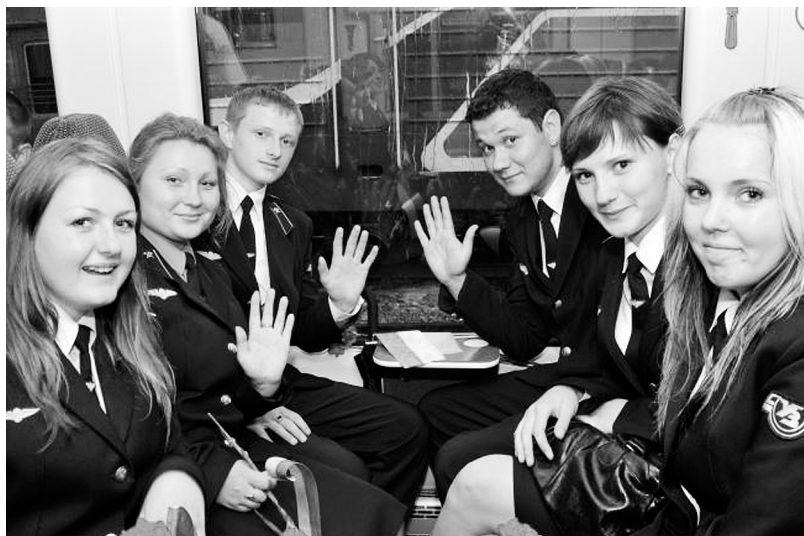
Молодь — майбутнє галузі і профспілки

МОЛОДІ, ЩАСЛИВІ, СИЛЬНІ – МИ У СПІЛЦІ ПРОФЕСІЙНІЙ