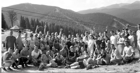
Коломия, 2012 р.

■ 19–21 червня 2012 року молодіжний актив зібрався в Коломиї для проведення навчального форуму, який організувала Рада профспілки за