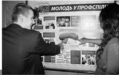
Делегати III Форуму біля стендів

З лютого по грудень 2012 року проведено огляд-конкурс на кращу профспілкову організацію щодо роботи з молоддю.