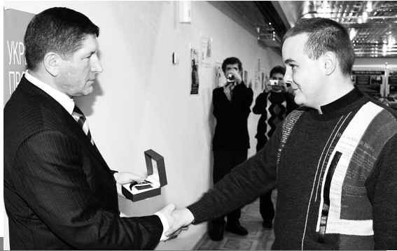
Вручення нагород молодим профспілковим активістам, 2009 р.