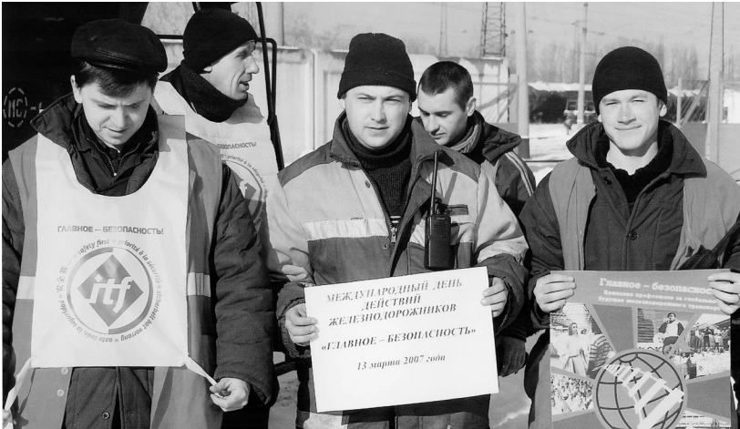
Учасники Дня єдиних дій МФТ

Профактивісти беруть участь у розробці інформаційних листівок зі зверненнями до пасажирів залізничного транспорту, разом із працівниками розповсюджують матеріали на вокзалах, проводять бесіди.