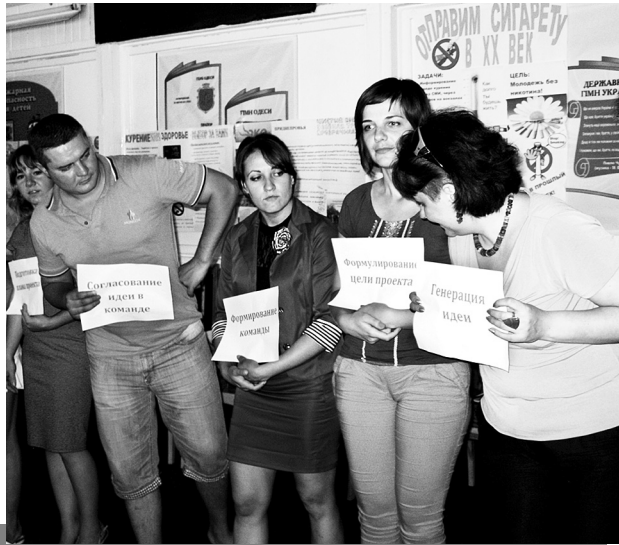
Семінар-тренінг для молоді, станція Бугаз, 2014 р.

Рада профспілки надала можливість лідерам молодіжних рад усіх рівнів отримати нові знання, систематизувати уже наявну інформацію, обмінятися ідеями та поділитися досягненнями, організувавши семі-