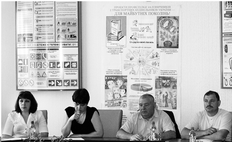
Семінар у рамках проекту «Отримай свій шанс», Жмеринка, 2012 р.

На цьому ж засіданні президії Ради профспілки було прийнято рішення взяти участь у проекті «Отримай свій шанс» через апробацію моделі наставництва на робочому місці для уразливих категорій молоді в Одеській та Вінницькій областях.