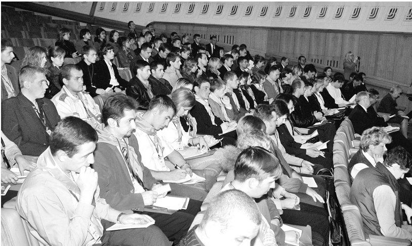
І Форум молоді, 2004 р.

Із завершенням процесу формування молодіжних рад первинних, об'єднаних, територіальних і дорожніх профорганізацій виникла необхідність створити Молодіжну раду профспілки, яка координуватиме їх роботу.