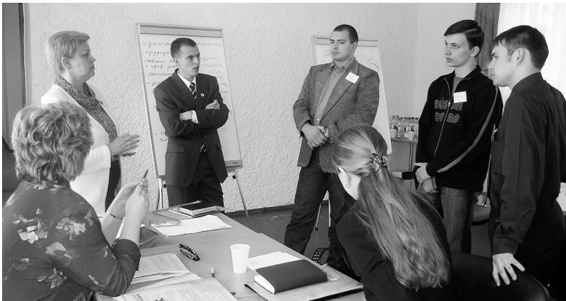
«Школа лідера», 2005 р.

Тож, отримавши теоретичні знання, молодь на місцях почала активно впроваджувати в життя свої ініціативи.