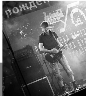
II рок-фестиваль «Продовжуючи життя», 2010 р.

Рада профспілки спільно з міжнародним проектом «Разом до здоров'я» провели два рок-фестивалі під гаслом «Продовжуючи життя».