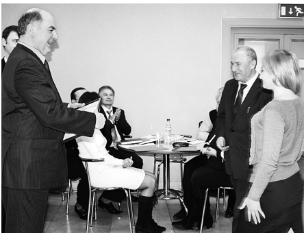
Серед переможців — Конотопська територіальна профорганізація

Прискіпливий погляд профспілки було спрямовано в бік забезпечення трудових прав і соціально-економічних інтересів молоді – працівників і студентів навчальних закладів залізничного профілю.