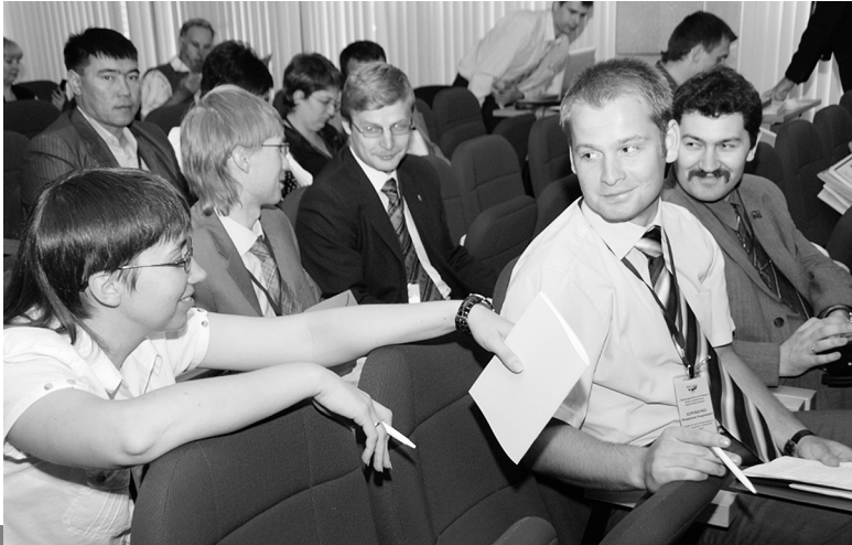
Під час I молодіжного форуму МКПЗ, Москва, 2008 р.

вня 2008 року у Москві, другий форум пройшов у Одесі 21–24 вересня 2010-го, третій – 17–18 квітня 2012-го у Сочі, четвертий – у Барановичах (Білорусь) 3–6 червня 2014 року.