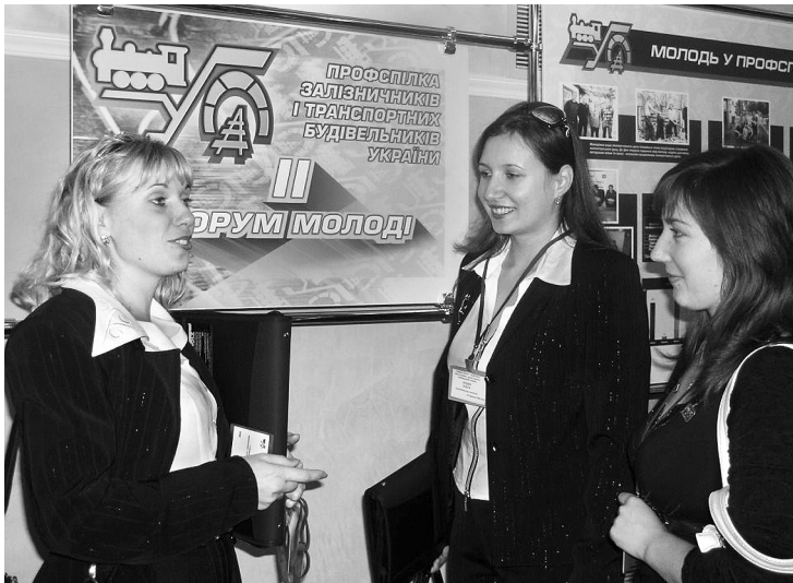
Київ, 2006 р.

28 вересня 2006 року відбувся II Форум молоді профспілки.