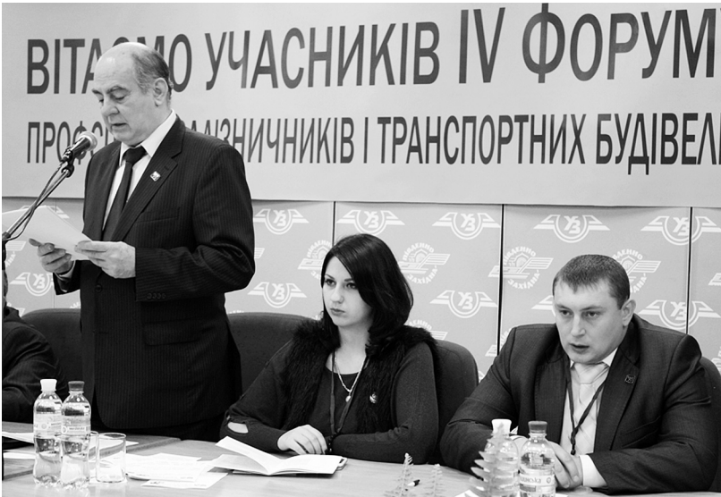
У президії ІV Форуму молоді профспілки. Київ, 2013 р.

У відповідності до Концепції політики профспілки щодо роботи з молоддю, Положення про молодіжні ради в профспілці та Програми підтримки молодих членів профспілки на 2012–2016 роки, спираючись на позитивний досвід роботи профспілки з грантовими проектами, з метою посилення молодіжної активності у пріоритетних для профспілки напрямках та підвищення ефективності діяльності молодіжних рад усіх рівнів президія Ради профспілки 26 вересня 2013 року затвердила Концепцію запровадження проектного підходу до реалізації молодіжної політики профспілки.