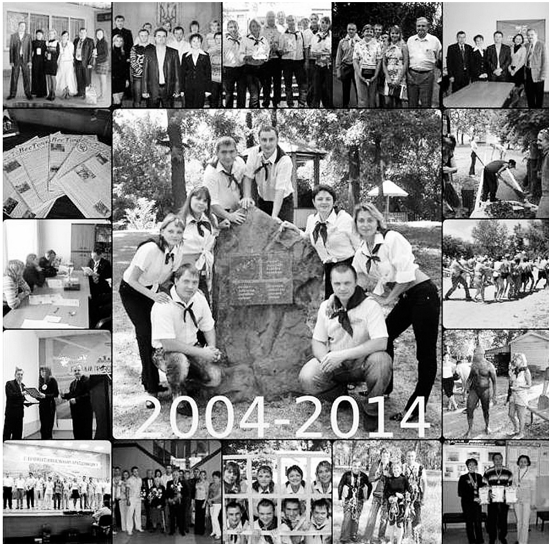
Молодіжна рада Краснолиманського теркому профспілки. Колаж

МОЛОДІ, ЩАСЛИВІ, СИЛЬНІ – МИ У СПІЛЦІ ПРОФЕСІЙНІЙ