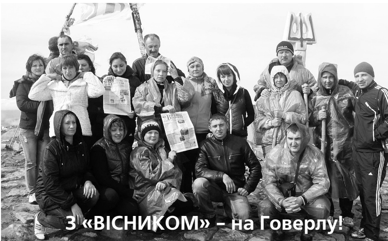
З «ВІСНИКОМ» – на Говерлу!

У «ВІСНИКУ» розширилася традиційна рубрика «Молодь у профспілці»: протягом 2012-го у тематичному розділі, присвяченому Року молоді, майже у кожному випуску виходили друком матеріали молодих активістів і їх старших колег про різноманітні починання, роботу молодіжних рад. Окремо у рубриці «Ініціатива молоді» висвітлювалися заходи, реалізовані у ході всеукраїнської благодійної акції «Протягни руку допомоги!», організатором якої виступила Молодіжна рада профспілки. Для багатьох молодіжних рад така робота – лише один з фактів постійної опіки над дітьми, які потребують додаткової уваги й турботи.