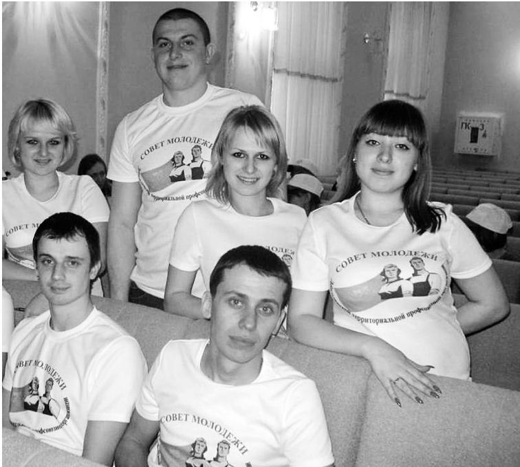
Учасники дорожнього семінару, 2012 рік

Помітні досягнення в цій роботі та зростання активності молодих спілчан у профспілковій діяльності відбулося завдяки створенню молодіжних рад. І вже на першій дорожній молодіжній конференції влітку 2004-го було чітко визначено напрямки діяльності молодіжних рад: виробництво, забезпечення новими робочими місцями, професійне зростання, виробничий побут, оздоровлення, соціально-культурна і духовна сфери. Перед молодіжними радами учнів і студентів було поставлено свої завдання: напрацювання пропозицій щодо формування дорожньої програми працевлаштування випускників, забезпечення студентів залізничних навчальних закладів місцями на час виробничої практики, дотримання трудового законодавства щодо умов праці підлітків і студентів протягом її проходження, виділення дотацій на здешевлення харчування дітей з малозабезпечених родин, заснування додаткових стипендій для дітей-сиріт, організація дієтичного харчування та інші.