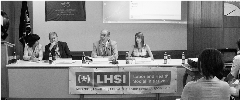
Підсумкова конференція, 2010 рік

Президією схвалено протокол взаємодії між проектом «Разом до здоров'я» та Радою профспілки і доручено Молодіжній раді профспілки підготувати проект плану спільних дій.