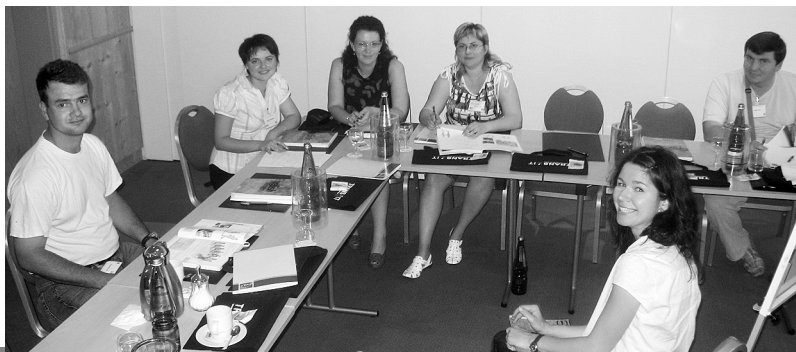
Семинар у Львові, 23–27 березня 2009 року

МОЛОДІ, ЩАСЛИВІ, СИЛЬНІ – МИ У СПІЛЦІ ПРОФЕСІЙНИЙ