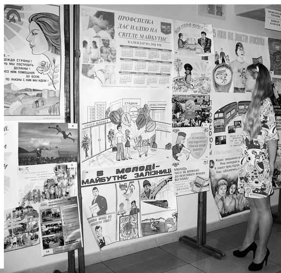
Виставка плакатів української делегації

У 2010-му міжнародну естафету прийняла Україна: 21–24 вересня в Одесі за організаційної підтримки Ради профспілки та Одеського дорожнього комітету профспілки пройшов II Міжнародний молодіжний форум МКПЗ.