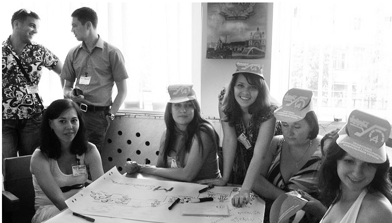
Коломия, 2012 рік

У рамках оголошеного «Року молоді в профспілці» на засіданні президії Ради профспілки 2 жовтня 2012 року розглянуто питання забезпечення трудових прав і соціально-економічних інтересів молоді – працівників і студентів навчальних закладів залізничного профілю.