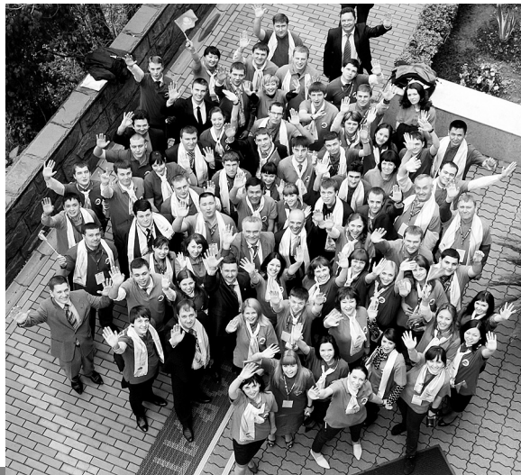
Сочі, 2012 рік

Після проведення цього форуму в соціальній мережі «Facebook» відкрито групу «МКПЖ & Молодежь», її членами стали чимало учасників форуму, які продовжують спілкування і обговорення проблем.