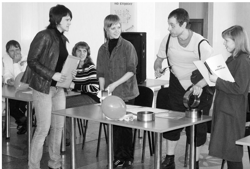
Учасники брейн-рингу з охорони праці

Молоді спілчани взяли під крило дитячі оздоровниці залізниці: щороку перед початком літнього сезону наводять лад у приміщеннях, облаштовують території. Наприклад, у 2007-му члени молодіжної ради первинки Іловайської дистанції електропостачання спорудили у дитячій оздоровниці «Зіронька» затишний «Куточок казок», впорядкували квіткові клумби. Їм на допомогу прийшли однолітки з локомотивного та вагонного депо, дистанцій колії, сигналізації та зв'язку, станції Іловайськ. А ясинуватські активісти стали ініціаторами проведення суботників з прибирання дитячої оздоровниці «Лісова пісня».