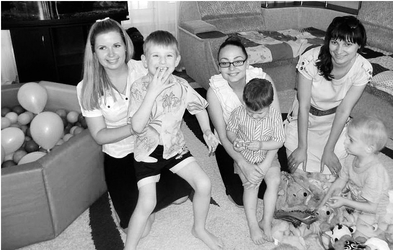
Молоді активісти-луганчани у підшефному дитячому будинку. 2011 рік

Молодь Донецької магістралі завжди приділяла серйозну увагу благодійності і волонтерському руху. Молоді активісти пишаються, що саме їхня залізниця надала поштовх проведенню на всіх магістралях Всеукраїнської благодійної акції «Протягни руку допомоги» зі збору коштів для вихованців дитячих будинків та інтернатів. Почалось все з того, що молодіжна рада Луганської територіальної профорганізації взяла шефство над обласним дитячим будинком № 1: активісти зібрали для дітей одяг, іграшки, канцтовари, проводили свята і концерти, навіть створили відеоролик і сайт, щоб якомога більше людей дізналися про проблеми дитячого будинку і способи йому допомогти.