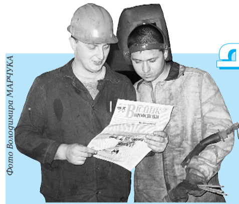
У вагонному депо Дебальцеве-Сортувальне...