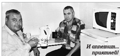
И аппетит... приятней!

Заменены двери, окна, кровля, напольное покрытие, а котел твердого топлива – на электрический. Появились раздевалки для рабочей и домашней одежды, просторная душевая, комната приема пищи, новая мебель, холодильник, микроволновая печь, электрочайник.