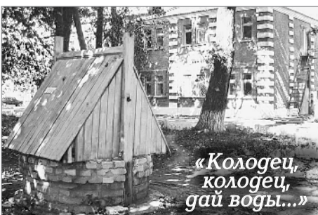
«Колодець, колодець, дай води...»

Вот только, по словам начальника станции