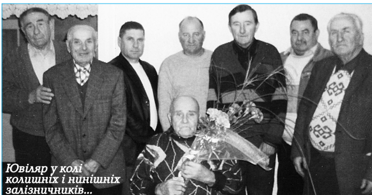
Ювіляр у колі колишніх і нинішніх залізничників...

Тепло привітали іменика працівники локомотивного депо Королеве, колишні колеги-ветерани.