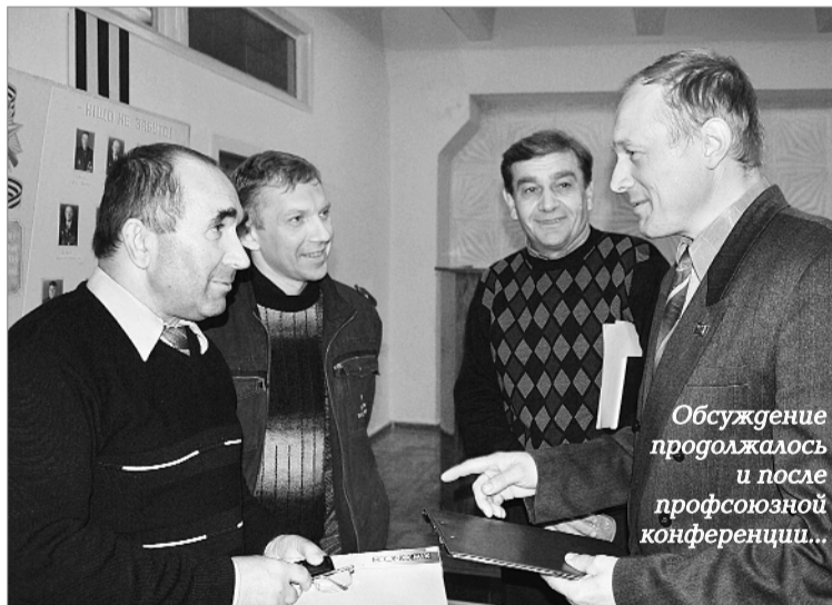
Обсуждение продолжалось и после профсоюзной конференции...

женность контактной сети не меняется, и более того – требует намного большего внимания, чем, скажем, лет 20 назад. Как можно содержать контактную сеть, если, например, на участках Зеленый Колодец