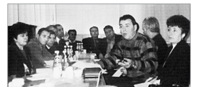
Засідання профсекції працівників вагонного господарства

П РОФЕСІЙНІ секції Ради профспілки, які було створено в 1997-му, в багатьох випадках висували вимоги щодо скасування документів, що істотно зачіпали трудові інтереси працівників. З ініціативи секцій і комісій актуальні питання, що безпосередньо стосуються сфери трудових інтересів окремих професійних груп, неодноразово розглядалися на засіданнях президії Ради профспілки.